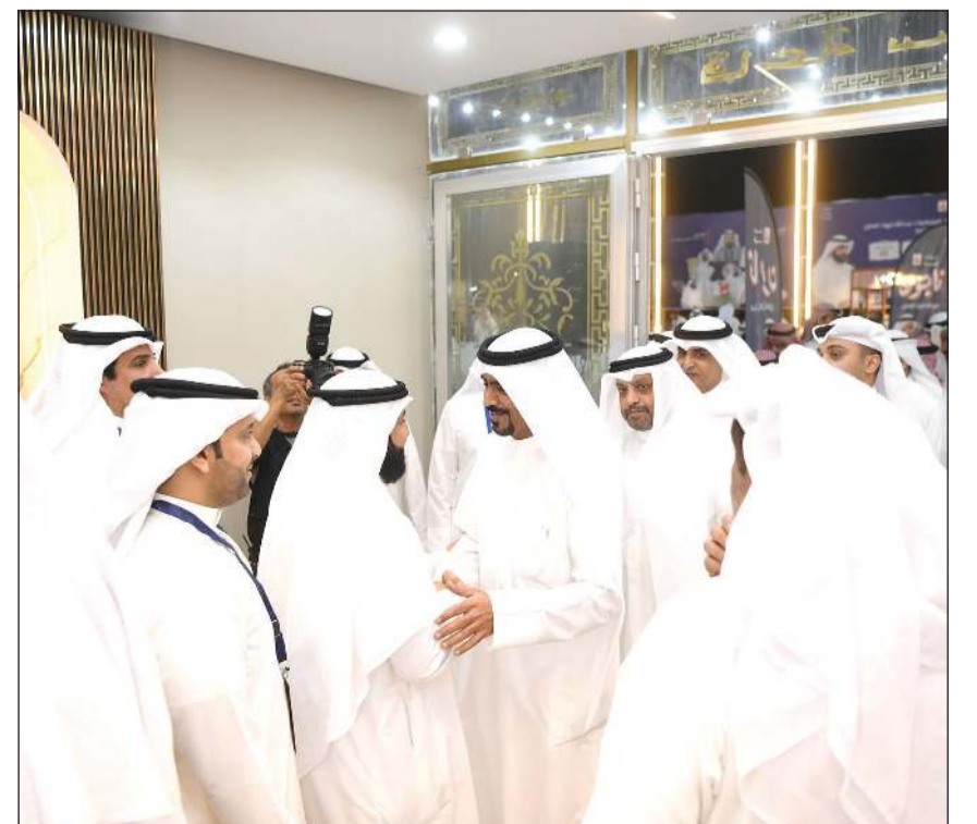
جانب من استقبال فهاد