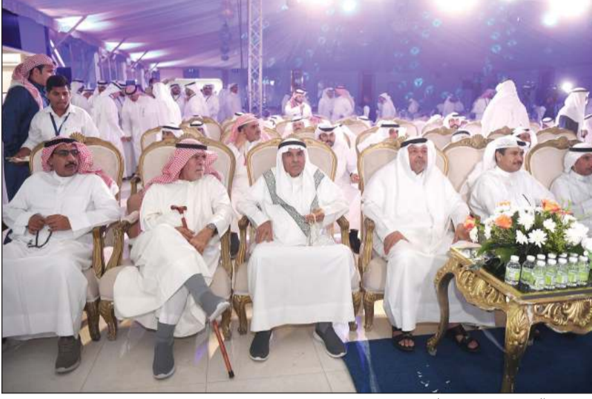
جمع من الحضور في مقر فهاد