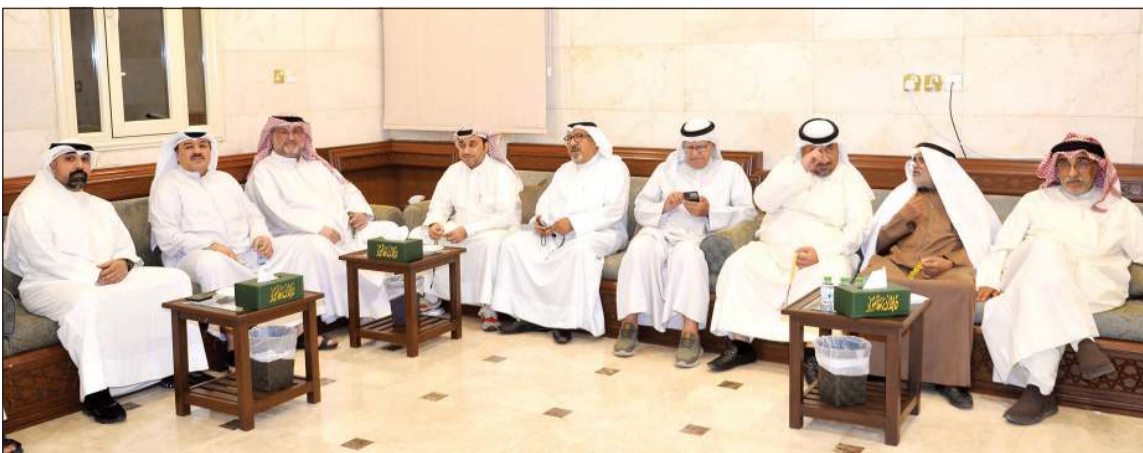
جانب آخر من الحضور