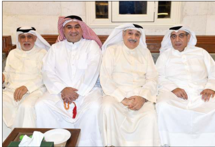
الحضور في ديوان عاشور