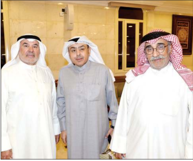
ترحيب بأبناء الدائرة