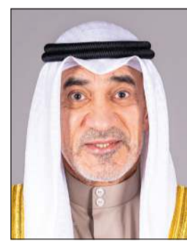
الشيخ فهد يوسف

الإقامة ولائحته التنفيذية، وذلك خلال الفترة من تاريخ 17 مارس 2024 حتى تاريخ 17 يونيو 2024، وهم «الأشخاص الذين لا يستطيعون دفع الغرامة أو تعديل وضعهم يمكنهم المغادرة من أي منفذ من منافذ البلاد المخصصة لذلك دون دفع أي غرامات، مع السماح لهم بالعودة مرة أخرى بإجراءات جديدة». وأضاف البيان أنه «يسمح للمخالفين بتعديل أوضاعهم