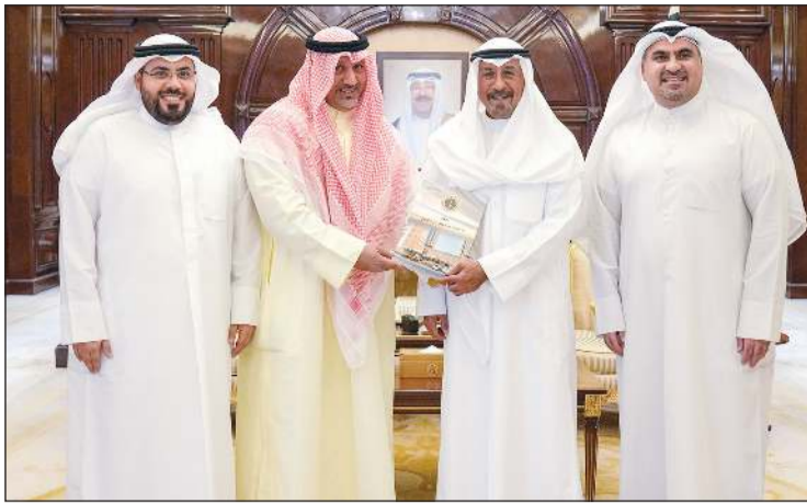
سمو الشيخ د.محمد الصباح خلال استقباله رئيس وأعضاء نقابة العاملين بالهيئة العامة للتعليم التطبيقي والتدريب