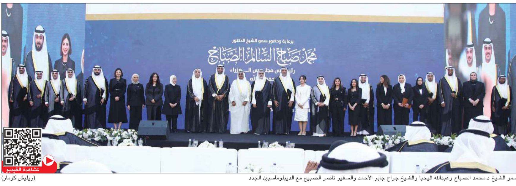
سمو الشيخ د.محمد الصباح وعبدالله الجحيا والشيخ جراح جابر الأحمد والسفير ناصر الصباح مع الديبلوماسيين الجدد

كامل لاستشراف مستحق من سموه عام 2006، وذلك من خلال تأمين اعتماد المرسوم رقم 350/2006 الخاص بإنشاء المعهد حين كان يتولى وزارة الخارجية آن ذاك. وأضاف ان في المعهد تاهل 432 ديبلوماسياً ( 286 من الذكور و 146 من الإناث) وهو ما يعادل 62% ديبلوماسي وزارة من الخارجية حالياً، كما أقيم 72 دورة تدريبية استفاد منها عدد 1060 متدرباً. ونظم 7 دورات ترقية لمستشار اجتازها عدد 164 مستشاراً. وأعد المعهد 30 دورة تدريبية خارجية لمنتسبي الوزارة استفاد منها عدد 312 منتسباً. وأتم دورتي نقل من كادر الوظائف المدنية إلى كادر الوظائف الديبلوماسية اجتازها عدد 150 ديبلوماسياً. ووقع 29 مذكرة تفاهم مع دول ومؤسسات مختلفة حول العالم.