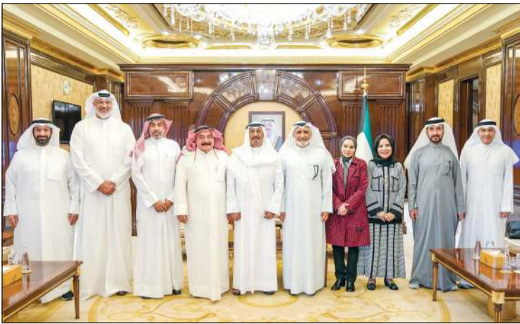
سمو الشيخ د.محمد الصباح مستقبلاً عدداً من أعضاء هيئة التدريس بجامعة الكويت