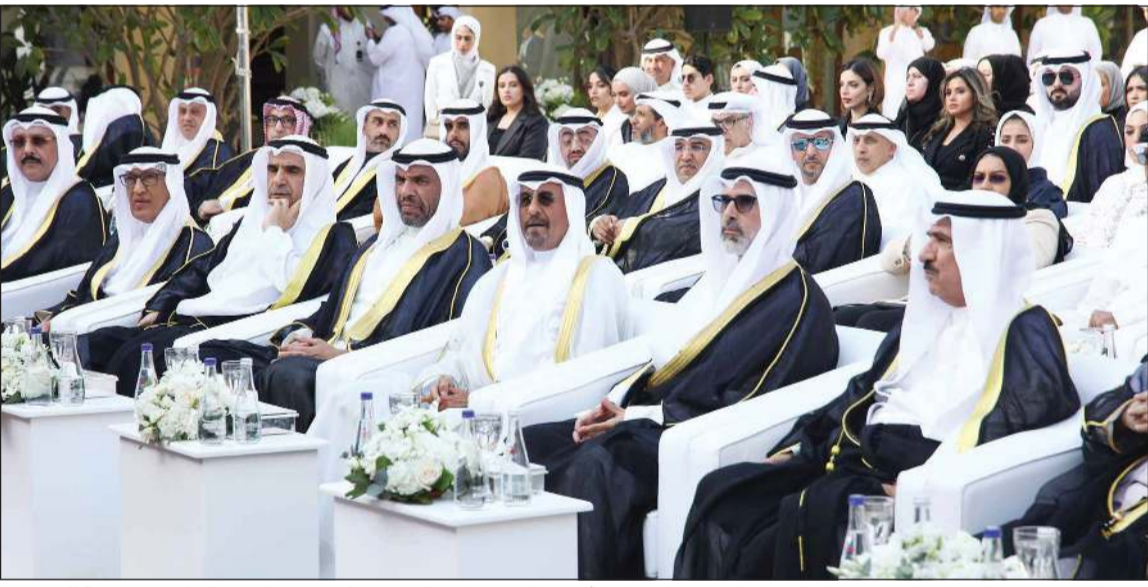
سمو الشيخ د.محمد الصباح والوزير عبدالله الجحيا والشيخ جراح جابر الأحمد والسفير ناصر الصباح والسفير عبدالعزيز الشارخ في مقدمة الحضور

الانحراف والخلل، لافتاً إلى أن الحكومة تتاحف مع الجهات المعنية الفنية في موضوع القرض الحسن على سبيل المثال واستطاعت الوصول إلى نتيجة تضمن الاستفادة للمتقاعد مع الحفاظ على سلامة الصناديق التقاعدية. وكشف عن ان الحكومة اختارت عدم إصدار مرسوم ضرورة بهذا الشأن، وقررت ان تنتظر انتخاب برلمان جديد ويكون باكورة التعاون بين البرلمان والحكومة لإقرار قانون جديد بهذا الخصوص. بدوره، قال مساعد وزير الخارجية لشؤون معهد سعود الناصر الصباح الديبلوماسي السفير ناصر الصباح: باسم كل منتسبي معهد سعود الناصر الصباح الديبلوماسي أتقدم بوافر الشكر وبالح التقدير لسمو رئيس مجلس الوزراء رعابته وتشريفه على حفل تخريج الديبلوماسيين الجدد لوزارة الخارجية. وأضاف انه من حسن الطالع أن يعرى رئيس الوزراء حفل تخريج كوكبة هي نتاج