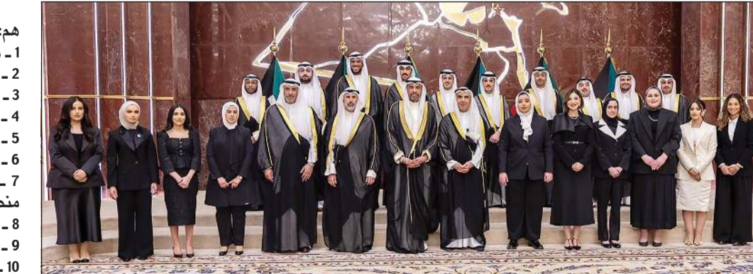
الوزير عبدالله الجحيا والشيخ جراح جابر الأحمد والسفير ناصر الصباح مع الملحقين الديبلوماسيين

في ظل التحديات والمصاعب العديدة التي يسببها جهونها في ميادين العمل وخاصة في ظل التحديات الإقليمية والدولية والتطورات التي تشهدها المنطقة متمنيا لهم المزيد من النجاح والتوفيق في خدمة الكويت وشعبها تحت ظل القيادة الحكيمة لصاحب السمو الأمير الشيخ مشعل الأحمد. وخبرات في دوراتهم التدريبية والبرامج التي تلقوها في مهامهم العملية وحتم على تمثيل دولة الكويت في الخارج التمثيل المشرف من أجل رفع شأنها في جميع المحافل الدولية، مؤكداً أهمية أداء مهامهم وواجباتهم على أكمل وجه، وشدد على ضرورة اليقظة والحد في عملهم