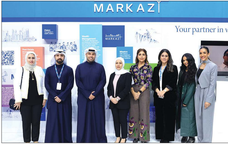
فريق «المركز» خلال مشاركته في معرض وظيفتي