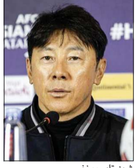
شين تاي يونغ

مرة في تاريخه، مشيراً إلى أن التأهل لهذه المرحلة كان مفاجأة سارة بالنسبة لهم، وهو ما قد يعكس بشكل إيجابي مستقبلاً على كرة القدم في إندونيسيا. وأعرب شين تاي عن أمله أن تقديم أفضل ما لديهم خلال المباراة المقبلة، مؤكداً أن اللاعبين سيبدلون قصارى جهدهم في المواجهة، وسيعملون على عكس التطور الذي وصل إليه المنتخب في مشاركته بهذه النسخة من البطولة في قطر، وستكون مواجهة أستراليا تحدياً كبيراً ينتظرهم.