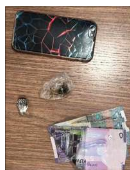
قطعة الحشيش المضبوطة مع التعاطلي

أحال رجال دوريات إسناد مديرية أمن الجوهراء مساء أمس شخصاً في حالة غير طبيعية إلى الإدارة العامة لمكافحة المخدرات بعد ضبطه في منطقة القصر وبحوزته مواد مخدرة وأدوات تعاط. وضبط «غير الطبيعي» إثر الاشتباه بسيارة تسير بسرعة جنونية وبعد الحاق بها وإجبار قائدها على التوقف تبين أنه بحالة تعاط وبقيته احتراناً عثر بحوزته على مادة مخدرة عبارة عن قطعة حشيش وأدوات تعاط.