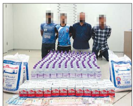
الموقوفون في وكر الخمور وأمامهم المضبوطات