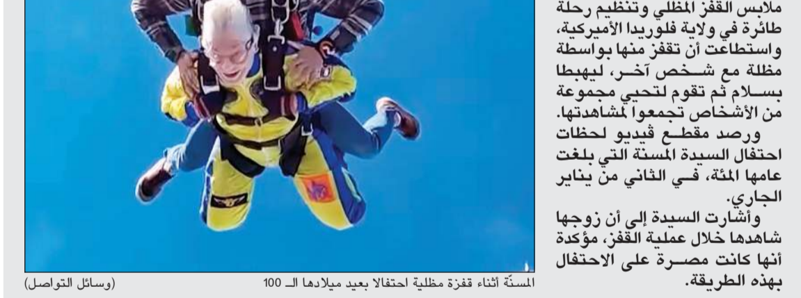
المسة أثناء قفزة مظلية احتفالاً بعيد ميلادها الـ100 (وسائل التواصل)

وقال الأمير فريدريك لصحيفة Kristeligt Dagblad، «لم يكن الأمر مجرد اندفاع حب، بل كان أيضاً شعوراً بلقاء توأم الروح».