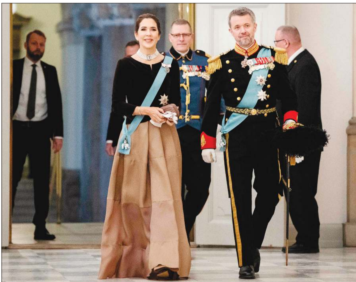
ولي عهد الدنمارك الأمير فريدريك وزوجته الأميرة ماري خلال حضورهما احتفالية في الرابع من يناير الجاري

كوينهاغن - أ.ف.ب: تعتبر الأميرة ماري، التي ولدت في أستراليا وستصبح بعد أيام ملكة الدنمارك، شخصية محورية في العائلة المالكة وساهمت في تحديثها. وستحصل الأميرة ماري على لقب ملكة الدنمارك عند اعتلاء زوجها فريدريك الذي سيحمل اسم فريدريك العاشر، العرش في 14 الجاري، بعد زهاء أسبوعين من تنازل والدته