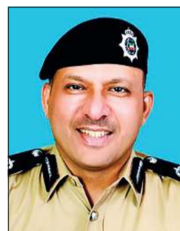
اللواء يوسف الخدة

أعلنت الإدارة العامة للمرور التي يرأسها اللواء يوسف الخدة أن إجمالي الحوادث المرورية التي تعاملت معها في الفترة من 30 ديسمبر الماضي حتى 5 يناير الجاري بلغ 324 حادثاً مرورياً جسيماً، و916 حادثاً مرورياً بسيطاً. وكشفت الإحصائية