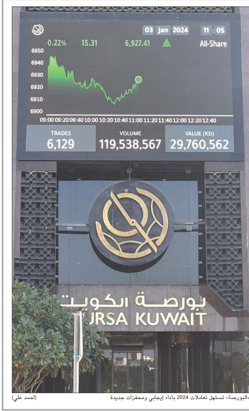
البورصة، تستهل تعاملات 2024 بأداء إيجابي ومحفزات جديدة (أحمد علي)