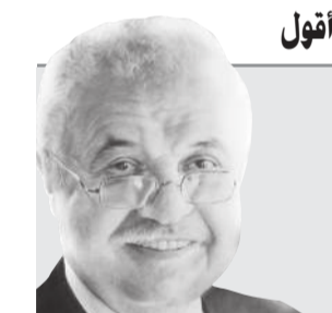
د. طلال أبوغزالة

إنجاز كبير ورائع تشكر عليه وزارة الصحة فقد نظم عملية الدفع مقابل العلاج وجعل الأموال تذهب مباشرة إلى خزينة وزارة الصحة. لكن هناك أمرا بسيطا أود لفت نظر وزارة الصحة وأرجو منهم التكرم بالنظر فيه وهي فئة العمالة المنزلية سواها الخدم أو السواق فكما هو معروف الأغلبية الساحقة منهم ليس لديهم حسابات بنكية، لذلك لا يمكن بطاقة بنكية قامت