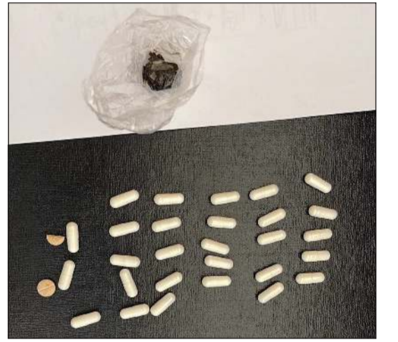
المضبوطات من الحبوب والكبسولات المخدرة والحشيش (عبدالله قنيص)

أحال رجال شرطة النجدة الى الادارة العامة لمكافحة المخدرات شخصاً بحالة غير طبيعية، وذلك بعد الاشتباه به خلال قيادة مركبة يابانية بيضاء اللون في ساعة متأخرة من يوم أمس على طريق الفحجيل، وبتفتيشه احترازياً عثر بحوزته على 28 كبسولة بيضاء اللون وحبّة ونصف الحبة يرجح أنها محظورة إلى جانب قطعة من مخدر الحشيش.