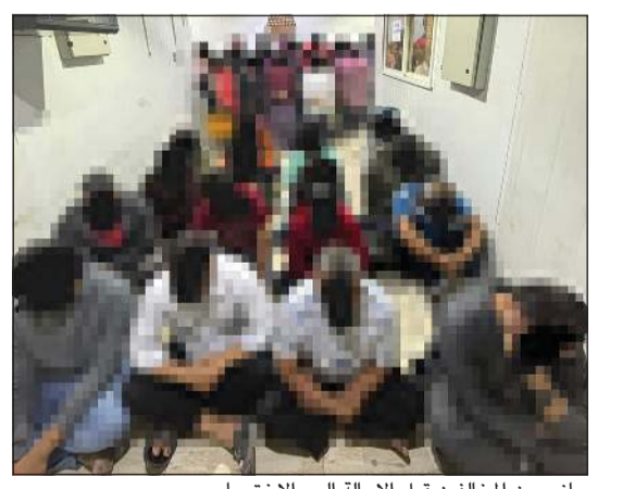
جانب من المخالفين قبل الإحالة إلى «الاختصاص»

أسفرت حملات تفتيشية للإدارة العامة لمباحث شؤون الإقامة على مناطق (الفروانية- خيطان- اسواق القرين- الصالحية- الشويخ الصناعية)، عن ضبط 300 شخص مخالف لقانون الإقامة والعمل من مختلف الجنسيات، كما تم ضبط 9 مخالفين يعملون بالمركبات الغذائية المتنقلة غير المرخصة، وذلك برفقة «القوى العاملة» وبلدية الكويت. هذا، وجر اتخاذ الإجراءات القانونية بحقهم، وإحالتهم إلى جهات الاختصاص.