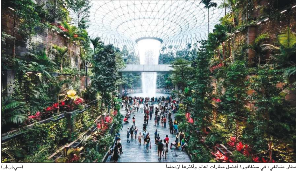
مطار «شانغي» في سنغافورة أفضل مطارات العالم وأكثرها ازدحاماً (سي.إن.إن)

الرحلة الوحيد في المراكز العشرة الأولى التي ارتفعت سعته الإجمالية منذ عام 2019. وتيمن آسيا أيضاً على تصنيف أكثر الخطوط الجوية المحلية ازدحاماً، حيث تحتل اليابان الصدارة، إذ احتلت الرحلات الجوية التي تربط مركز طوكيو ووجهات العطل الشهيرة فوكوكا (مركز رئيسي لعشاق الطعام وبوابة إلى كوريا الجنوبية)، وسايبرو (محبوبة الرياضات الشتوية)، وأوكيناوا (المعروفة باسم «هاواي اليابان») في المراكز الثاني والثالث والسابع على التوالي.