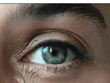
وتم جمع الدموع التي تتساقط على وجوه النساء أثناء مشاهدتهن أفلاماً حزينة.

وشملت التجارب 31 رجلاً استنشقوا إما محلولاً ملحيًا أو دموع النساء، وشارك الرجال في لعبة محوسبة تستخدم في علم النفس لإثارة السلوك العدواني من خلال خصم نقاط اللاعبين بشكل غير عادل.