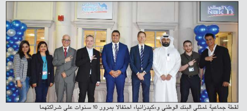
لقطة جماعية لممثلي البنك الوطني وكيدزانيا، احتفالاً بمرور 10 سنوات على شراكتها

وأضاف: «تعمل كيدزانيا تماماً كمدينة حقيقية بالكامل تتضمن مباني وشوارع مهيبة ومركبات ووجهات عاملة ومعروفة في شكل مؤسسات ترعاها علامات تجارية رائدة متعددة الجنسيات ومحلية تحمل شعارها. وقد صممت هذه المرافق للتعلم من خلال الخبرة وتعزيز تنمية المهارات العملية، ولكن من وجهة نظر الأطفال - فهي تجربة تقدم لهم المتعة.. وطوال 10 سنوات، حققت كيدزانيا مسيرة حافلة بالنجاح في الكويت، حيث استقبلت مدينة الترفيه والتعلم التفاعلية على مدار هذه السنوات أكثر من 3 ملايين طفل من أكثر من 65 مؤسسة، قدمت لهم أكثر من 82 نشاطاً من أنشطة لعب الأدوار و70 مهنة مختلفة. وحاز مفهوم الترفيه في كيدزانيا على جوائز معترف بها عالمياً لما يقدمه من مزيج فريد بين الترفيه والتعليم للأطفال، حيث يمكن للأطفال أن يعيشوا تجربة في العالم الحقيقي، يتعلمون منها كيف يصبحون مواطنين أفضل.»