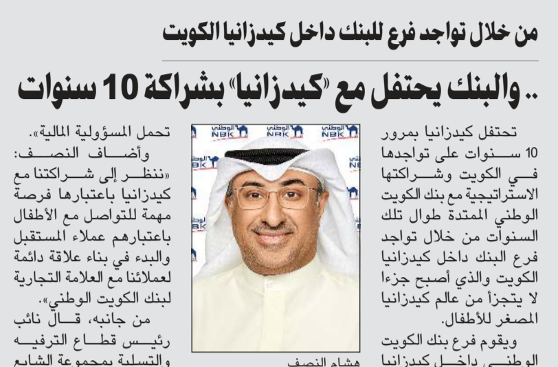
من خلال تواجد فرع للبنك داخل كيدزانيا الكويت

■ اقتصاد الكويت غير النفطى يسجل نمواً قوياً بـ 3٪ خلال 2023.. بدعم انتعاش الاستهلاك الشخصي ■ نمو معدل التوظيف بالنصف الأول ليلعب حجم السوق 2,5 مليون عامل.. ما يجد من نقص العمالة