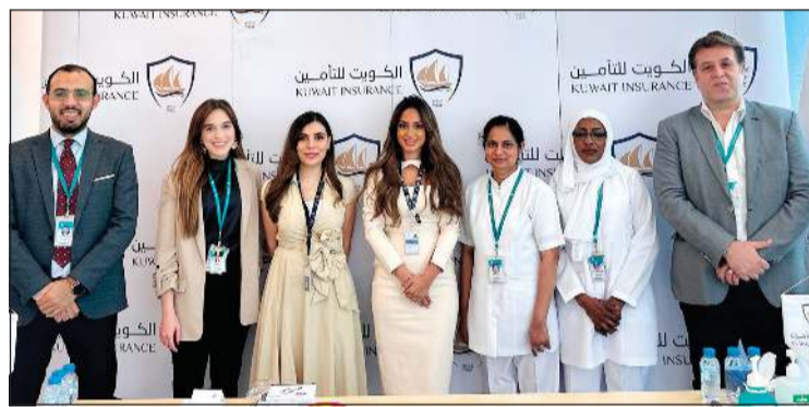
فريق «الكويت للتأمين» خلال الحملة التوعوية

نسب الإصابة بمرض السكري، بالإضافة إلى أن أعداداً كبيرة عرضة للإصابة بهذا المرض أو من لديهم ما يسمى بمرحلة ما قبل السكري، وأن بإمكانهم تجنب الإصابة باتباع نمط حياة صحي. وأكدت الصايغ أن مثل تلك المبادرات في مجال المسؤولية الاجتماعية ستسهم في تحسين نمط الحياة بكل المراحل العمرية ورفع المستوى الصحي والثقافي والوعي العام الذي يسهم في