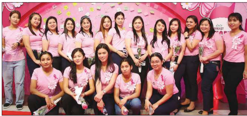
صورة جماعية للمشاركات في الحملة

مرض سرطان الثدي في المجتمع. وخلقت حملة التوعية لولو هايبر ماركت منصة لرفع الوعي وتثقيف الجمهور من خلال معلومات طبية دقيقة من أطباء منتدى الأطباء الهنود، وقدمت الدعم للأفراد المتأثرين بسرطان الثدي، ومن خلال مشاركة العملاء والمجتمع بنشاط، لم تقدم الفعالية معلومات قيمة فحسب، بل حققت شعوراً بالتمكين للأشخاص المتأثرين بهذا المرض.