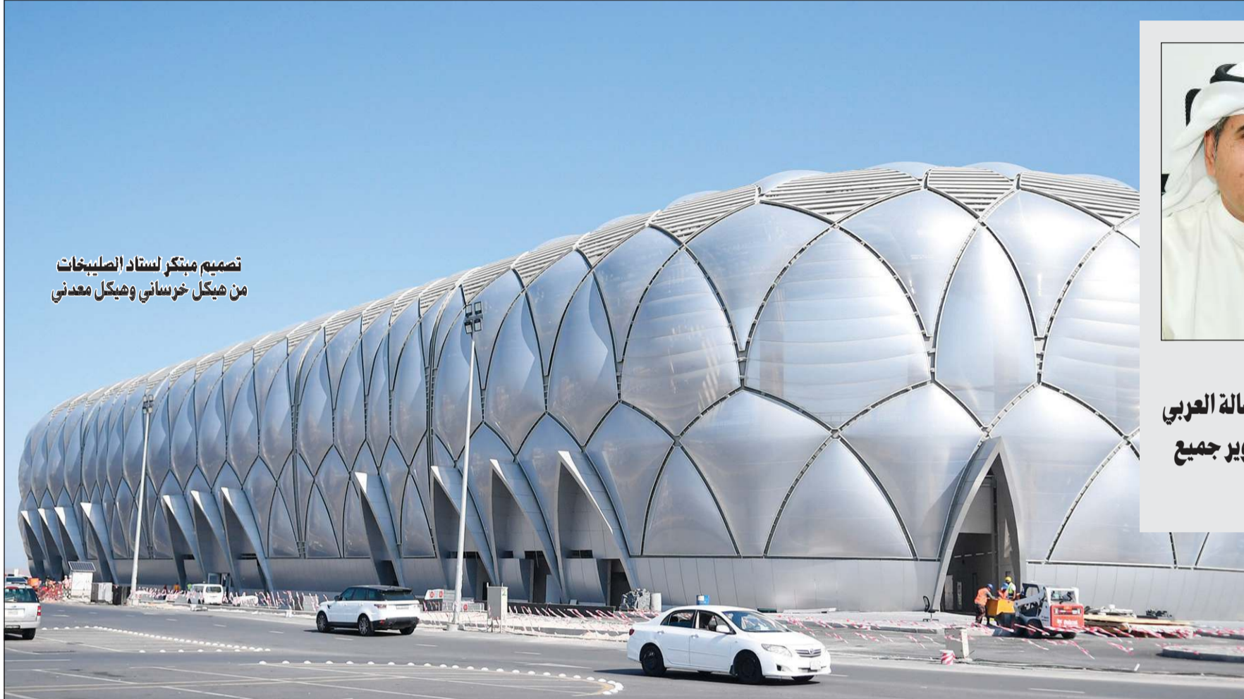
تصميم مبنى ستاد الصليبخات من هيكل خرساني وهيكل معدني

«دُرْتَان» جديتان» ستنضم إلى منشآتنا الرياضية قريباً. فصالة الألعاب الجماعية بالنادي العربي وستاد نادي الصليبخات الجديتان سيزدان بهما الوسط الرياضي، بما يمثلانه من إضافة مهمة للساحة الرياضية الكويتية. من شأنها الإسهام في تطوير الرياضيين والناشئين والشباب، والأخذ بيد الرياضة إلى مستويات متقدمة في شتى المجالات، وتفتح الباب واسعاً لاستضافة البطولات القارية والدولية، فضلاً عن كونها يعززان المشاركة المجتمعية في بيئة رياضية مثالية وصحية. وقد حرصت الهيئة العامة للرياضة، بصفتها المالك للمشروعين على أن يتم إنجازهما وفق أحدث النظم المعمارية الرياضية المعاصرة، وأعلى معايير الجودة سواء من حيث التصميم الخارجي، أو التفاصيل الداخلية ذات الاختصاص الرياضي.