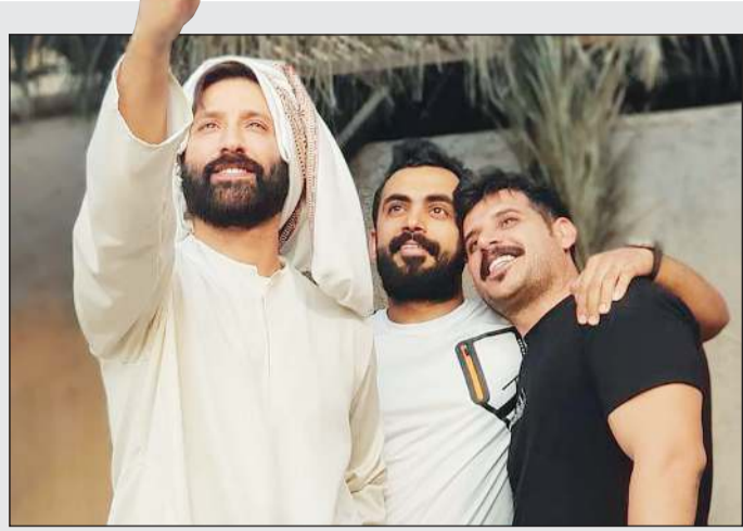
من كواليس المسلسل

أكد لـ «الأنباء» أن «غلطة الشاطر بألف» في هذه الأعمال