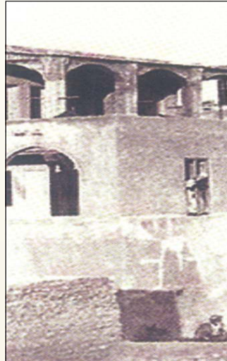
ديوان ومنازل ابراهيم من الجهة الغربية ممتدة من البحر إلى داخل اليابسة

الكتاب القيم يضم بين جنياته وثائق وأغلفة كتب وصور وخرائط وباركودات ولوحات وقصاصات جرائد ومجلات ورسائل متبادلة، وبعد قراءتي للكتاب برصدت عدد هذه الوثائق والصور والخرائط والباركودات واللوحات والقصاصات ويبلغ عددها أكثر من 270 وثيقة، وكلها ذات قيمة تاريخية تؤكد مصداقية المعد في سرده لمجريات رصد التاريخ. وقد أحسن المعد عندما أقرد المعلومات الخاصة بالشيخ محمد صالح ابراهيم ووالده الشيخ صالح ابراهيم الذي ساهم في بناء السور وفي حرب الجهراء وأرسل رجاله للدفاع عن الكويت وتبرع لسنة الهدامة عام 1934.