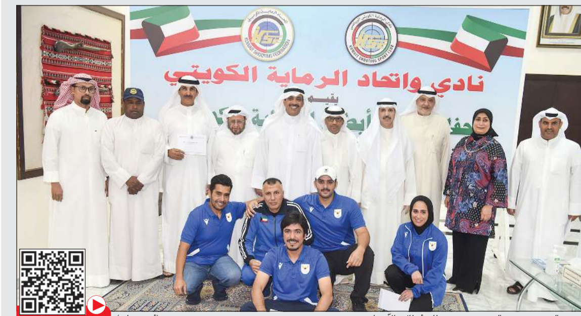
دعج العتيبي وعبيد العصيمي بتوسطن أبطال «الآسياد» (أحمد علي)