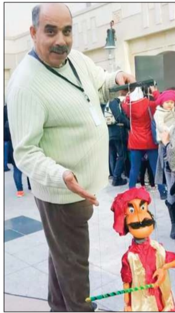
الفنان التونسي الراحل لسعد المجواشي

بعد ذلك بدأت مراسم التكريم وتوزيع الجوائز، حيث منحت لجنة التحكيم شهادات تقدير لكل من عرض «أنجيون» من ليتوانيا، و«ملف 12» من العراق، و«عرض الرجل الذي أكله الورك» من مصر.