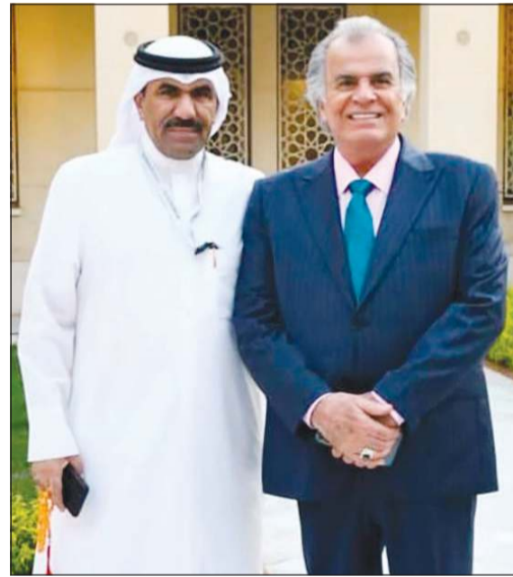
«الأنباء» مع الفنان جواد الشكرجي