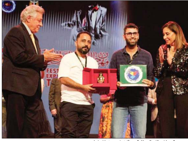
مسرحية «ملف 12» العراقية - أفضل سينوغرافيا