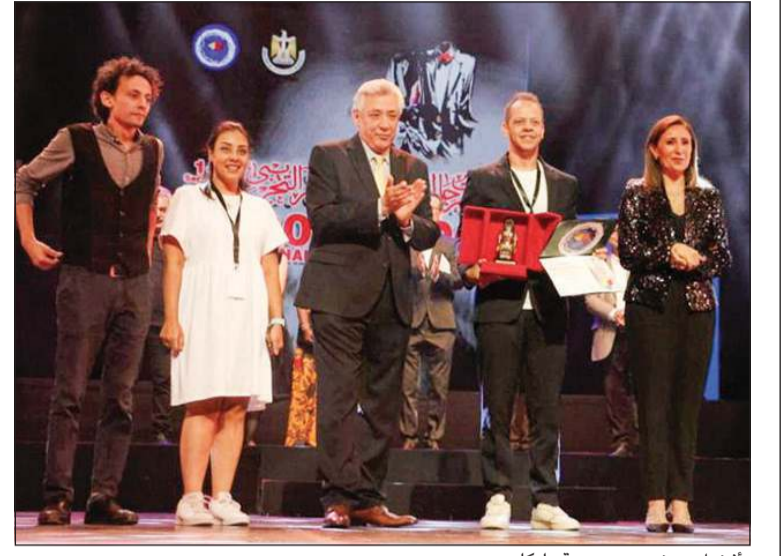
«أفضل عرض»: مسرحية «إيكاروس» - مصر

اختتم أنشطته في القاهرة.. والجزائر تحصل على أفضل ممثلة والعراق والكونغو وجورجيا تفوز بـ «السينوغرافيا» و«النص» و«الإخراج»