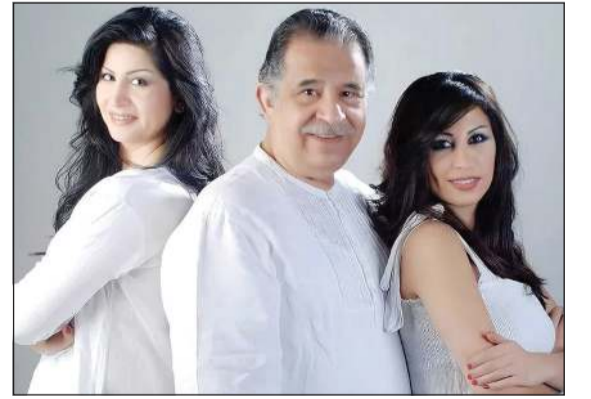
المخرج والفنان مظهر الحكيم وابنته أماني ونسرین

كما قام الفنانون بزيارته للاطمئنان على صحته، مطالبين بالكشف عن وضعه الصحي، كما أشادوا بالتصرف الراقي من قبل نقيب الفنانين محسن غازي ومتابعته لحالته الصحية.