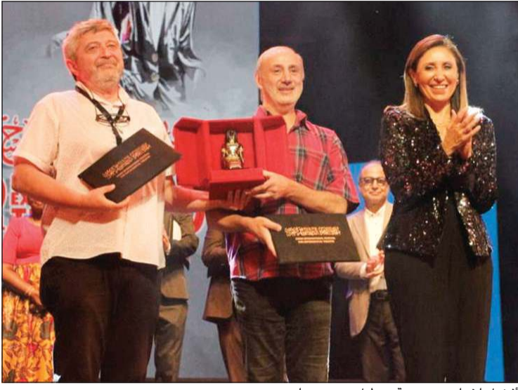
أفضل إخراج: مسرحية «عطيل» - جورجيا