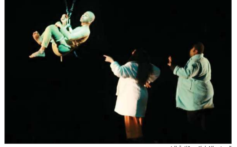
العرض الإماراتي «قائمة الخديج»

قدمتها الإمارات وسورية - ألمانيا ضمن المسابقة الرسمية لـ «القاهرة التجريبي الـ 30» و«APNEA» الإيطالية تدعو للحب