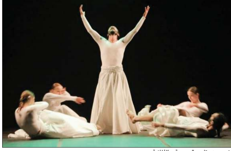
مشهد من «تابو» السورية - الألمانية