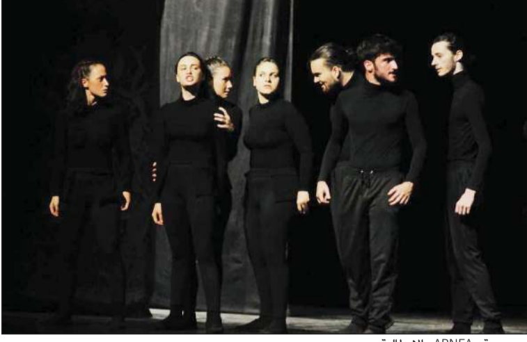
مسرحية «APNEA» الإيطالية