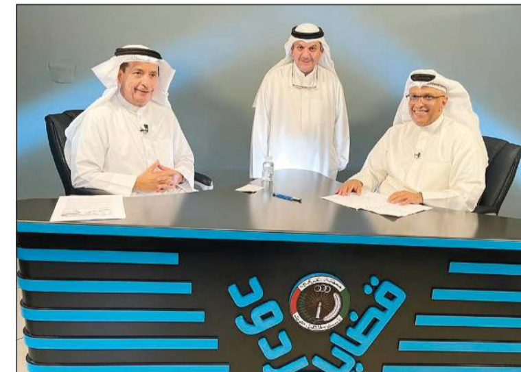
حلقة وزير المالية الأسبق د.يوسف الإبراهيم