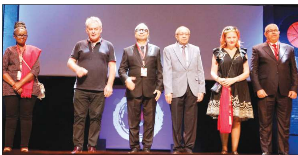
أعضاء لجنة تحكيم الدورة 30 لمهرجان القاهرة للمسرح التجريبي