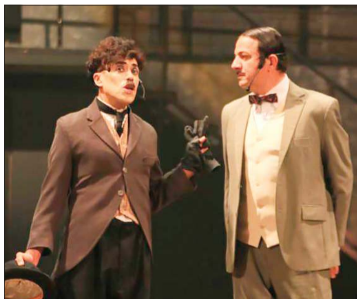
مشهد من مسرحية «تشارلي»