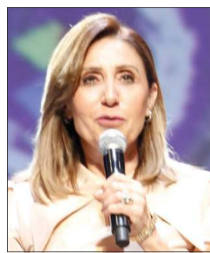
وزيرة الثقافة المصرية د.نديفين الكيلاني