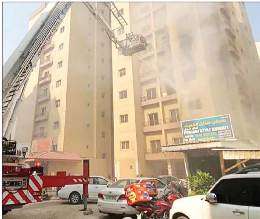
رجال الإطفاء تعاملوا مع الحريق بواسطة السلالم الكهربائية

حريق بعمارة مكونة من 10 أدوار بمنطقة المهولة. وأوضحت الإدارة أن إدارة العمليات المركزية وجهت فرق إطفاء من مركزي المنقف والفحيحيل إلى موقع البلاغ وعند وصول الفرق تبين أن الحريق شبقة في الدور الثالث ويوجد أشخاص محتجزون، وعلى الفور تم إنقاذهم وإخلاء العمارة من جميع السكان والسيطرة على الحريق وإخماده.