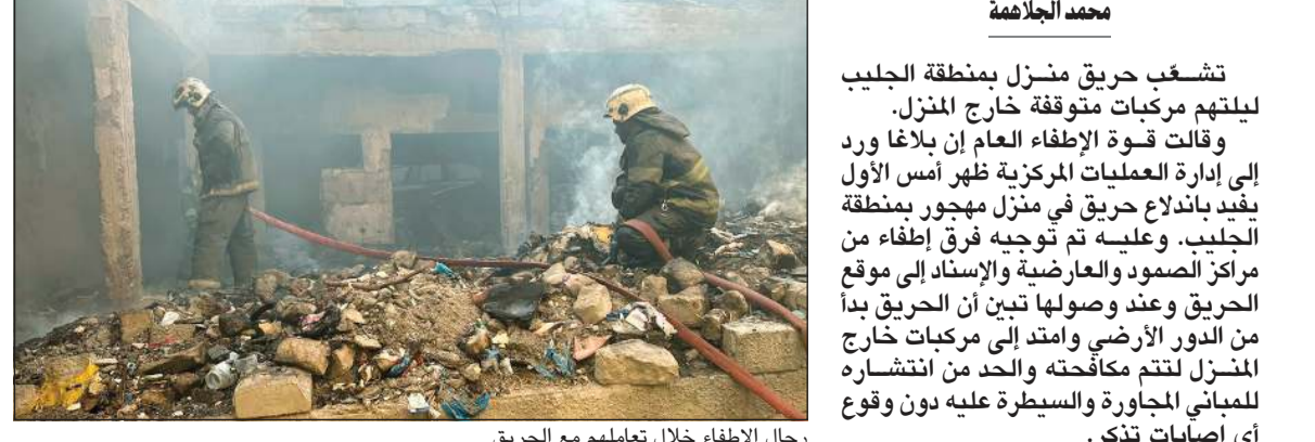
رجال الإطفاء خلال تعاملهم مع الحريق