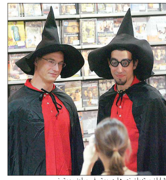
شابان يرتديان زي هاري بوتر في برلين