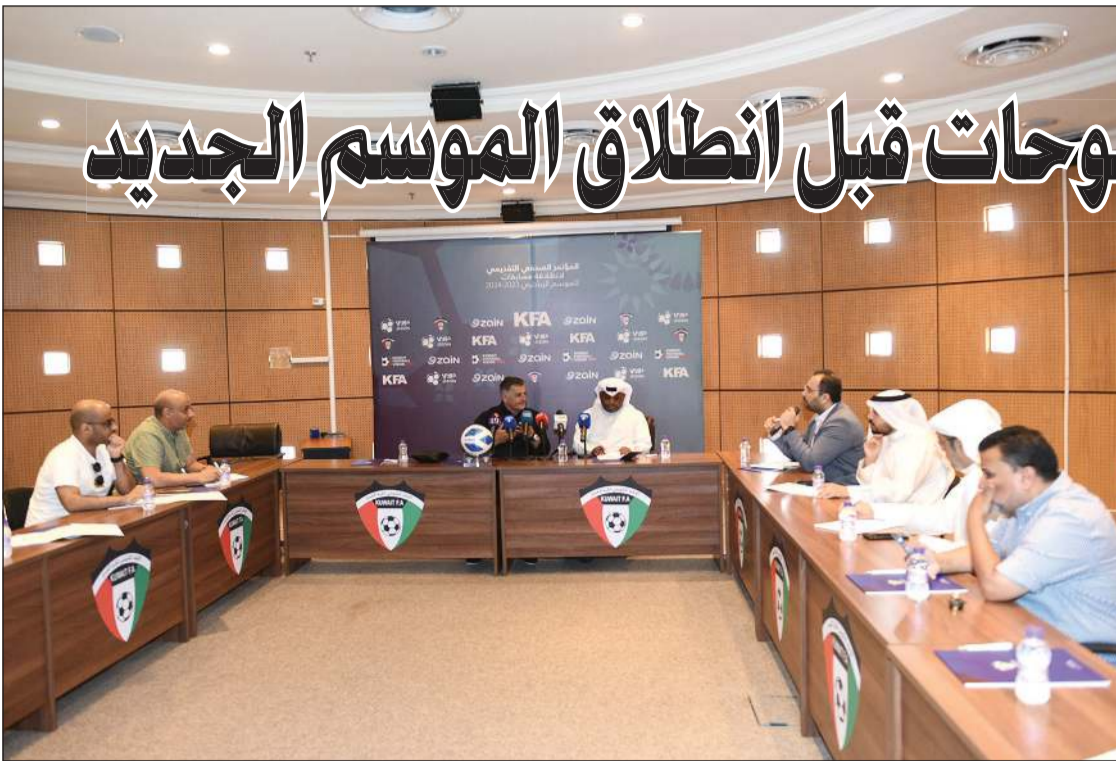
جانب من سلسلة المؤتمرات الصحافية التي عقدت لمدربي الأندية بمناسبة قرب انطلاق الموسم الكروي الجديد (متمين غوزال)

البعض أبدى رضاء خلال مؤتمر صحفي عن حجم العمل في الفترة السابقة.. وآخرون مقتنعون بالواقع