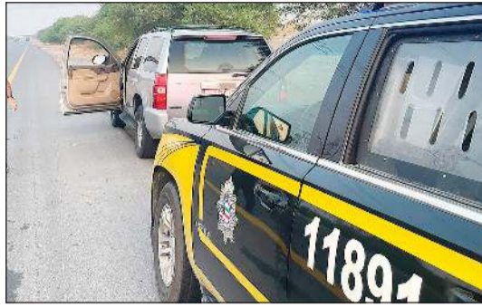
دورية النجدة والمركبة بعد انتهاء المهمة بنجاح

للتواصل معه لتعريفه بالكية التعامل، وعليه تمكن أحد رجال الأمن من السير بجانبه وإعطائه هاتفاً وإبلاغه بالتلاحم معه لتخفيف سرعة المركبة بالاصطدام بالدورية أكثر من مرة وتكثرت تلك الجهود التي امتدت لدقائق بإيقاف المركبة بنجاح عند جسر العريفيجان، وبمعاينة السيارة ثبت أن خلال حدث، وأن الدعسة علقته من منذ سيره مقابل جسر برج التحكم نزولاً من الدائري الخامس.