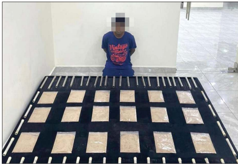
المتهم وأمامه المضبوطات

تكثرت تدخل رجال إدارة أمن الطرق الجنوبية بإنقاذ قائم مركبة مواطن شاب تعطلت منه دعسة البنزين، حيث تمكن رجال الأمن من تسليمه هاتف أحد رجال الأمن والتواصل معه لإنقاذه وتعريفه بكيفية التعامل مع الواقعة، وبالفعل جرى الاصطدام من قبل الدورية ثلاث مرات. وكان قد ورد بلاغ من غرفة العمليات بوجود شخص علقته دعسة البنزين بسيارته خلال سيره على طريق الأحمدي باتجاه النوصيب، وعلى الفور تم الإيعاز إلى رجال دويات الأمن بسرعة التعامل مع البلاغ حيث استطاعوا تحديد مكان على جسر الوفرة باتجاه النوصيب وقاموا بفتح الطريق أمامه. وأضاف المصدر: وأجرت رجال الأمن اشكالية تعلقت بنفاذ بطارية هاتفه النقال