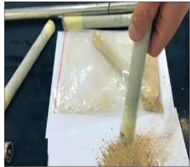
الهيروين النقي تم إخفاؤه بطريقة مبتكرة داخل أنابيب فولاذية

كما أشارت إليه «الأنباء» في نسختها الورقية وعلى الموقع الإلكتروني أمس الأول، أعلنت وزارة الداخلية أن الإدارة العامة لمكافحة المخدرات أحبطت عملية تهريب نحو 2 كيلوجرام من الهيروين النقي، حاول شخص من جنسية أسبانية إدخالها إلى