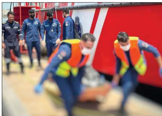
جثة الوافد الهندي في طريقها إلى «الأدلة الجنائية»

مواليد 1994 فوجي به يلقي بنفسه من أعلى جسر جابر، مشيراً إلى أن الوقت لم يسعفه لأي تدخل.