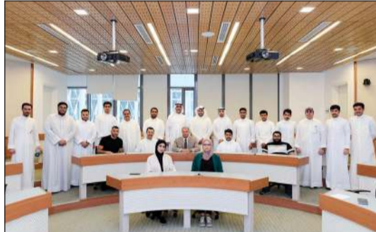
ممثلو إدارة الموارد البشرية في بنك بويان يتوسطون طلبة جامعة الكويت