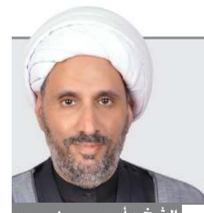
الشيخ د.أحمد حسين محمد