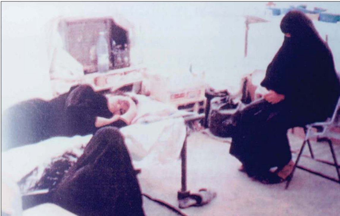
العمل التطوعي في المستوصفات الطبية أثناء الغزو

● الغزو بأكمله كان أليماً كبيراً بالنسبة للكويتيين، والألم جاء بعد خيانة وغدر من قبل العدوان الغاشم،