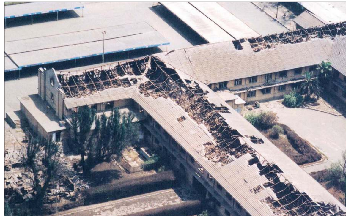
جانب من الدمار في البنى التحتية للبلاد التي أحدثها الاحتلال