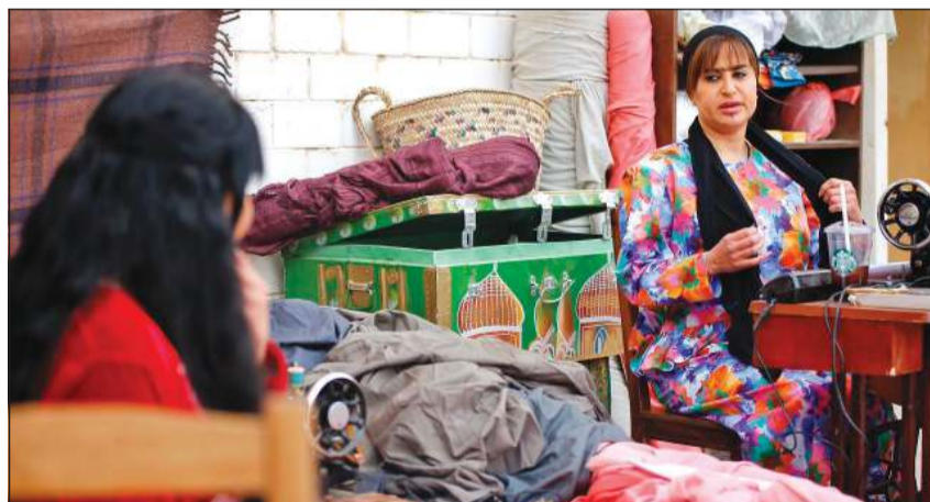
أنسام في مشهد من المسلسل