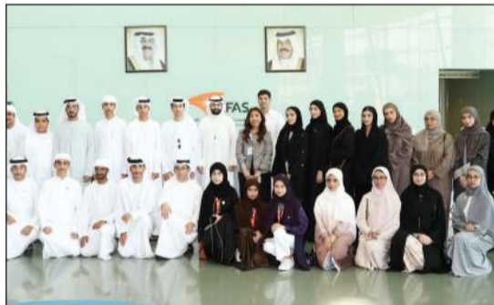
صورة جماعية للوفد لدى زيارته معهد دسمان العسكري

وشارك في الموسم الحالي وفد من مؤسسة «ربع قرن لصناعة القادة والمبتكرين» من دولة الإمارات العربية المتحدة الشقيقة، حيث تأتي المشاركة من الطلبة إثر إتمام برنامج «مديرو العلوم التنفيذيون» وتعزيزاً لمبادئ الأخوة في دول مجلس التعاون الخليجي.