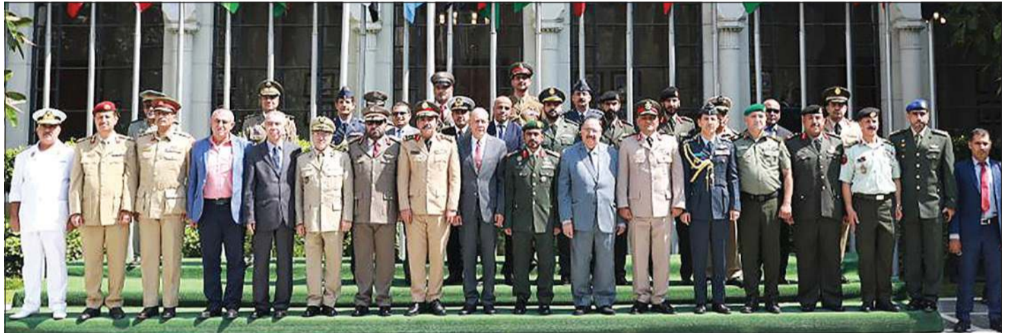
العميد الركن محمد الردهان مع ممثلي هيئات التدريب بالقوات المسلحة العربية المشاركين بالندوة في لقطة جماعية

تعتبر من الأخطار المحدقة بالأوطان العربية وقواتها المسلحة». وأوضح أن «الجماعات الإرهابية والتنظيمات المسلحة غير النظامية استغلت التطور العلمي والتكنولوجيا الهائل والاعتماد على التقنيات الحديثة لخلق أساليب جديدة تهدف إلى زعزعة استقرار الأوطان بالاعتماد على سهولة الحصول على هذه التكنولوجيا».