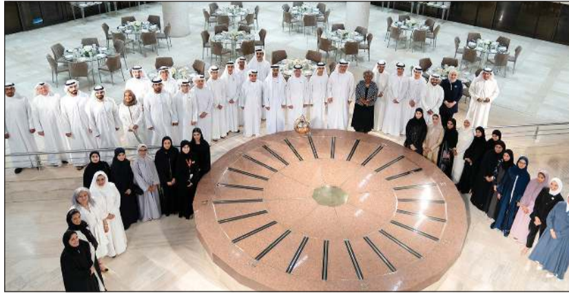
السفير الإماراتي د.مطر النيايدي مع الوفد المشارك في البرنامج