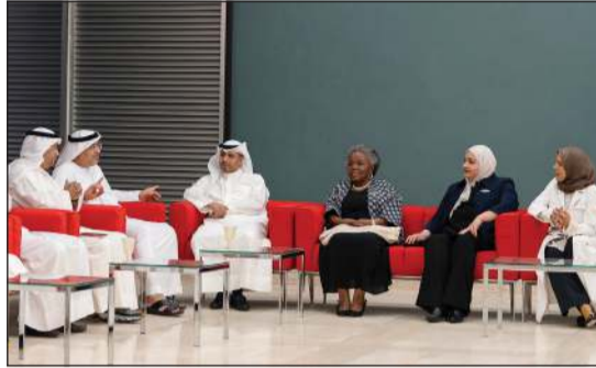
السفير الإماراتي د.مطر النيايدي ود.أمينة فرحان وعدد من الحضور

محمد القاسمي رئيس المؤسسة، وهي أول مؤسسة إماراتية وعربية وأقليمية ترمي إلى بناء جيل إماراتي قادر على قيادة المستقبل والتأثير فيه ملتزم بهويته الوطنية. وكانت «التقدم العلمي» قد أطلقت في 9 الجاري موسم 2023 للمرحلة الثانوية من برنامج «مديرو العلوم التنفيذيون» والذي يهدف إلى تحفيز الطلبة من الصف التاسع إلى الثاني عشر على الاهتمام بمجالات العلوم والتكنولوجيا والهندسة والرياضيات «STEM»، وتعزيز قدراتهم على التواصل العلمي ونشر المعرفة العلمية في المدارس والمجتمع.