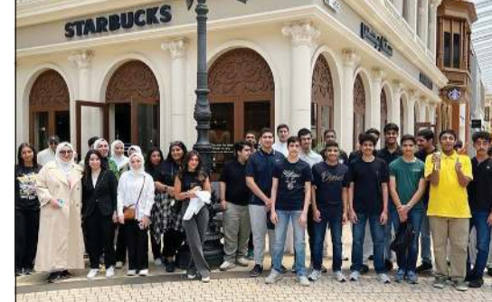
جانب من الطلبة المشاركين في التدريب

أعلنت نائب مدير عام شؤون القوى العاملة الوطنية بالتكليف في الهيئة العامة للقوى العاملة نجاة اليوسف عن انطلاق مشروع تدريب الطلبة للعمل في القطاع الخاص خلال الفترة من 2023/7/9 حتى 2023/8/7. وقالت اليوسف إن أهداف مشروع تدريب الطلبة تكمن في استقطاب شريحة الشباب ممن على المقاعد الدراسية وذلك من خلال إلحاقهم ببرامج تدريبية عملية تهدف إلى خلق الوعي بأهمية العمل بالقطاع الخاص وأثره على التطوير المهني والوظيفي للفرد، وإبراز أهمية التدريب في تاهيل غير الحكومية لما له من أثر في جاهل وإعداد الطلبة وتقوية وبناء مهاراتهم ودعم قوتهم بانفسهم ليتمكنوا من دخول بوابة