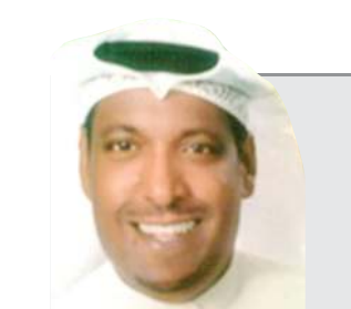
كتب/ علي الرندي

إعلامية ومن ثم ابتعدت تلك الأسرة عن القاهرة وغادرتها إلى «طابا» لتعزل نفسها عن «الميديا» والصخب الدنيوي والتطور التكنولوجي إلى أن يحضر لهم أخو رب الأسرة طالبا منهم تخليص بعض الأوراق