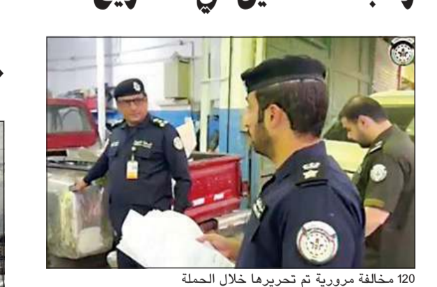
مخالفة مرورية تم تحريرها خلال الحملة

أسفرت حملة في منطقة الشويخ الصناعية بمشاركة وزارة الداخلية ممثلة في إدارة الفحص الفني ووزارت التجارة والصناعة والكهرباء والماء وبلدية الكويت عن إغلاق 3 ورش، وجرى فصل التيار الكهربائي عن ورشتين وتحرير 8 مخالفات لورش أخرى. كما أسفرت الحملة التي استمرت لنحو 3 ساعات عن وضع 223 استنكر إزالة على مركبات مهملة، كما تم ضبط 3 وادفين مخالفين وتحرير مخالفات إقامة عمال في منشأة صناعية وتحرير 120 مخالفة مرورية.