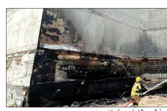
واجهة البرج التجاري وقد تضررت

بلاغ إلى إدارة العمليات المركزية صباح أمس بفيج وجود حريق محدود في برج تجاري في محافظة العاصمة لبتيم الأيعان إلى مركزي المدينة والهلال، وعند وصول الفرق تبين أن الحريق في تلبيسة الجزء الخارجي من المبنى وتم السيطرة