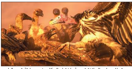
صورة «السيطر» الحائزة تسمية «اختيار الحكام» في مسابقة قسم الطيور

كونا: شارك الفلكي الكويتي خالد الجمعان في برنامج الاتحاد الفلكي الدولي لتسمية الكواكب والنجوم المكتشفة مؤخرا من قبل وكالة الفضاء الأميركية (ناسا). وقال ممثل الاتحاد الفلكي الدولي للكويت خالد الجمعان، في تصريح لـ «كونا»، إن هذه المشاركة تعد الأولى من نوعها للكويت، مؤكدا أن المشاركات الدولية العلمية تعزز مكانة البلاد بمجال علم الفلك في الأوساط الدولية.