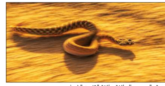
صورة «الهرب» الحائزة جائزة التنويه الشرفي