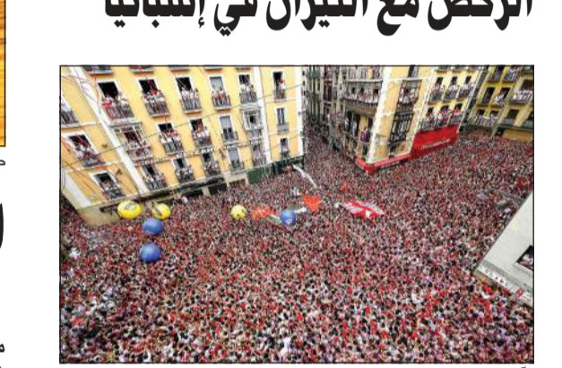
الألاف يشاركون في انطلاق مهرجان الركن مع الثيران شمال إسبانيا

مريد - روبرت: احتفلت مدينة ماملونا في شمال إسبانيا ببدء مهرجان شهير للركن مع الثيران يستمر لتسعة أيام وذلك براسم وإطلاق ألعاب نارية في احتفال يعرف باسم (شوبيناسو). وفي الساحة الرئيسية في المدينة وكل الشرفات المظلة عليها، احتشد آلاف المحترفين وهم يرتدون ملابس بيضاء عادة ما تحولها بقع حمراء يحتفلون برشها على ثيابهم إلى السون الوردية. وبعد سماع صوت إطلاق ألعاب نارية أبدأ المهرجان، هفت الحشود «بحيا سان فيرمين» في إشارة لقديس المدينة الذي يجبلونه ثم انطلقت فرقة موسيقية لتعزف الأنا تقليدية على آلات نفخ وطيول في مسيرة احتفالية بالساحة. وهذا العام هو الذكرى المائة لأول زيارة للكاتب والروائي الأمريكي الشهير إرنست هيمغواي للمهرجان الذي اشتهر عالميا من خلال روايته الصادرة عام 1926 (ذا صن السو رايزين) أو «سوف تشرق الشمس».