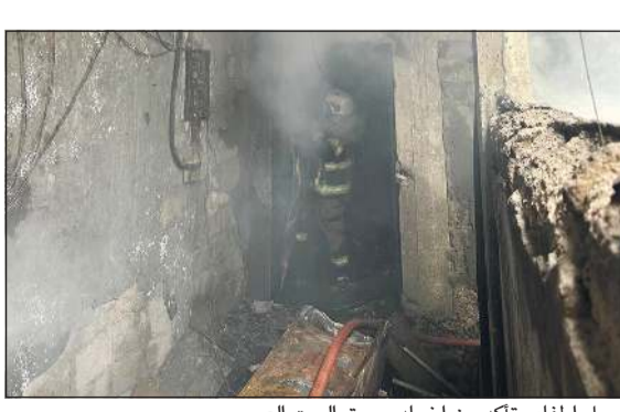
رجل إطفاء يصوب المياه نحو السنة اللهب