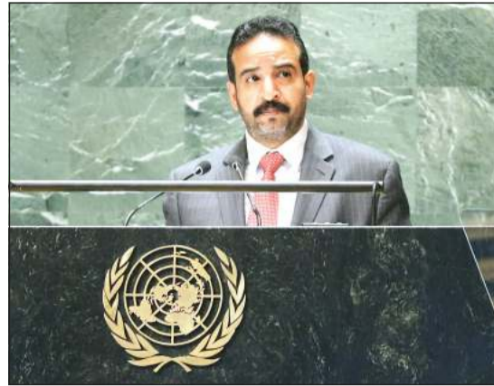
المستشار عبدالعزيز عمّاش يلقي بيان الكويت

المكسيكية التي تطالب بالامتناع بشكل طوعي عن استخدام حق النقض «فيتو» في الجرائم ضد الإنسانية، كما تقدمت مع مجموعة من الدول بقرار أمام الجمعية العامة والمعنون بـ «مبادرة حق النقض»، والذي تم اعتماده بتوافق الآراء، مشيراً إلى أنه من شأن هذا «القرار التاريخي» أن يعزز دور الجمعية العامة وتمكينها بما يسهم في تقوية علاقتها مع مجلس الأمن.