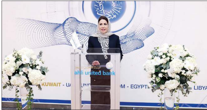
جهد الحميضي تلقي كلمة بمناسبة تسلم الجائزة

تسلّمت الرئيس التنفيذي وعضو مجلس إدارة البنك الأهلي المتحد جهد الحميضي، «جائزة المصرفي الإسلامي للعام 2023 في منطقة الشرق الأوسط وشمال أفريقيا»، والتي حصلت عليها من مجلة ميد العالمية المرموقة، وذلك تقديراً لقيادتها الاستثنائية ودعمها للابتكار التكنولوجي في القطاع المصرفي، وخبراتها المتنوعة.