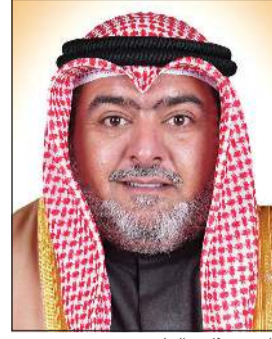
الشيخ ثامر العلي

الدول في المناطق الساخنة تعيد تقييم متطلباتها العسكرية لمواجهة التهديدات المتزايدة من حولها