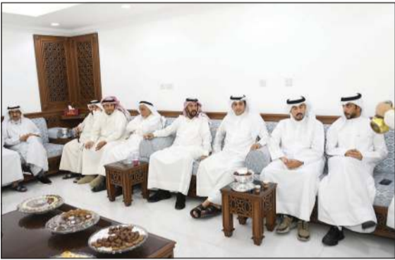
جانب آخر من الحضور

استقبل النائب د.فلاح الهاجري أبناء الدائرة الثانية في ديوانه مساء أمس الأول. وتبادل مع الحضور في ديوانه الحديث عن مستجدات الساحة السياسية، لاسيما بعد التشكيل الحكومي الجديد. ورحب الهاجري بالحضور، متمنياً أن تحقق الحكومة تطلعات المواطنين وعلى الحكومة أن تتحمل مسؤولياتها فالكويت بحاجة إلى تضافر الجهود والشعب يطلب منا ومنها الكثير، ونمد يد التعاون معها بما تقدمه من إصلاحات سياسية وإنجازات في الملفات العالقة.