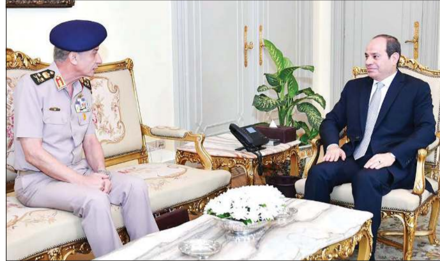
الرئيس عبدالفتاح السيسي مستقبلاً الفريق أول محمد زكي القائد العام للقوات المسلحة وزير الدفاع والإنتاج الحربي

كما وجه الرئيس السيسي بالعمل على تعظيم الاستفادة من تلك المعرفة لأقصى مدى ممكن، في ضوء ما يوفره من إمكانيات فريدة وهائلة للتعليم والتدريب وإتاحة جميع أنواع العلوم والمعارف للمواطنين المصريين، بالإضافة إلى دوره في تنمية المهارات وإعداد خريجين قادرين على تلبية متطلبات سوق العمل، إلى جانب زيادة الإنتاجية البحثية بالجامعات المصرية والمراكز والهيئات البحثية المصرية. جاء ذلك خلال اجتماع