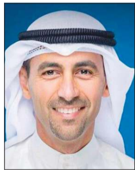
الشيخ نواف السعود

عدد الشواغر المقررة لهذا الإعلان، والتي كانت أقل من عدد المجتازين أعلاه إلا أن هذه الجهود أثمرت