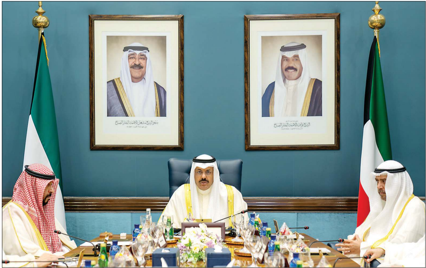
سمو الشيخ أحمد نواف الأحمد الصباح مترسدا الاجتماع الأول لمجلس الوزراء وعن يمينه الشيخ طلال الخالد وعن يساره الشيخ أحمد الفهد

اختيار باقي اللجان البرلمانية عن طريق التزكية.. و«الثلاثية» بذلت جهداً واضحاً حول عملية التنسيق حسم اللجان «الصحية» و«التعليمية» و«الميزانيات».. بالانتخاب والإرشاد ولجنة الميزانيات والحسابات الختامية عليها إقبال كبير من قبل الأعضاء، حيث لم يتم التوافق على عضويتها من خلال التزكية، وسيتم اختيار أعضائها من خلال الانتخاب بعد جلسة افتتاح دور الانعقاد العادي الأول من الفصل التشريعي السابع عشر المقررة اليوم الثلاثاء. هذا، وشددت المصادر على أن إقبال النواب على هذه اللجان وإفصاحهم عن مشاريعهم التي يعتزمون تقديمها وتنفيذها يبشر بالخير نحو مزيد من الإنجاز خلال المرحلة المقبلة. ماضي الهاجري - سلطان العبدان رغم ما بذلته اللجنة الثلاثية المكلفة بالتنسيق بين أعضاء مجلس الأمة من جهد واضح لتحديد عضوية اللجان البرلمانية عن طريق التزكية، إلا أن الإقبال النيابي على بعض اللجان حال دون إتمام عملية التزكية الكاملة لها، الأمر الذي سيحتاج عنه حسم 3 منها من خلال الانتخاب واختيار الباقي عن طريق التزكية. مصادر نيابية قالت لـ «الأنباء» أن اللجنة الصحية ولجنة التعليم والثقافة