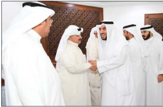
الهاجري خلال ترحيبه بالحضور