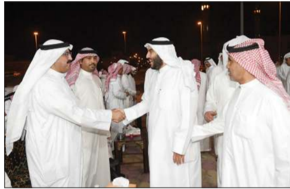
.. ويستقبل آخرين