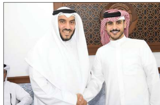
د.فلاح الهاجري مع أحد الحضور

استقبل النائب د.فلاح الهاجري أبناء الدائرة الثانية في ديوانه مساء أمس الأول. وتبادل مع الحضور في ديوانه الحديث عن مستجدات الساحة السياسية، لاسيما بعد التشكيل الحكومي الجديد. ورحب الهاجري بالحضور، متمنياً أن تحقق الحكومة تطلعات المواطنين وعلى الحكومة أن تتحمل مسؤولياتها فالكويت بحاجة إلى تضافر الجهود والشعب يطلب منا ومنها الكثير، ونمد يد التعاون معها بما تقدمه من إصلاحات سياسية وإنجازات في الملفات العالقة.