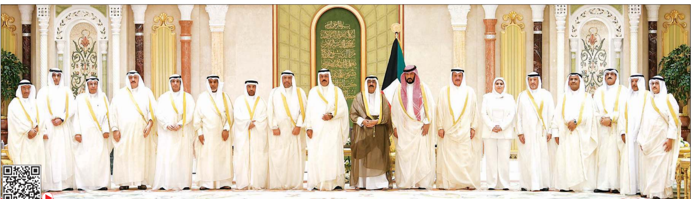
سمو نائب الأمير وولي العهد الشيخ مشعل الأحمد وسمو الشيخ أحمد نواف الأحمد الصباح والشيخ طلال الخالد والشيخ أحمد الفهد وعيسى الكندري ود.سعد البراك والشيخ فراس السعود وفالح الرقبة ود.جاسم الاستاد ومناف الهاجري والشيخ سالم العبدالله ود.أمانى بوقمان وفهد الشعلة وعبد الرحمن المطيري ود.أحمد العوضي ود.محمد العدواني ومحمد العيبان والأمين العام لمجلس الوزراء صالح سليمان الملا في الصورة التذكارية لأعضاء الحكومة الجديدة