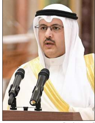
الشيخ فراس السعود