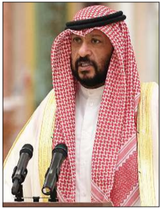
الشيخ طلال الخالد يؤدي اليمين الدستورية