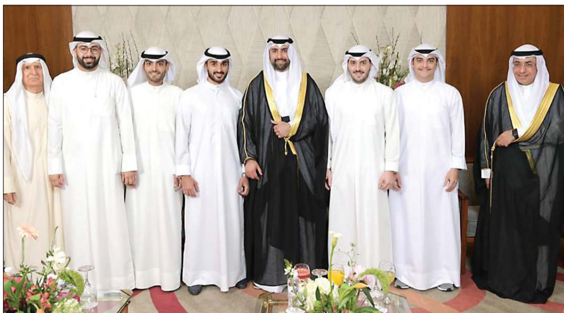
مباركة للمعرس من الأهل والأصدقاء