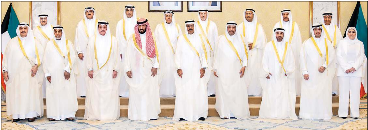
رئيس الوزراء سمو الشيخ أحمد نواف الأحمد الصباح متوسطا أعضاء الحكومة وأمين عام مجلس الوزراء صالح الملا في لحظة جماعية

رئيس الوزراء: هذه المرحلة المهمة من تاريخ الوطن تستوجب التعاون بين السلطتين التنفيذية والتشريعية وتجسيد هيبة القانون وحسن تطبيقه على الجميع دون استثناء طلال الخالد: الكويت وأهلها أمانة غالية في أعناقنا.. ومستمررون في جميع جهود مكافحة الفساد والحفاظ على المال العام وحمائته وإعلاء راية القانون لينعم المواطن بالاستقرار