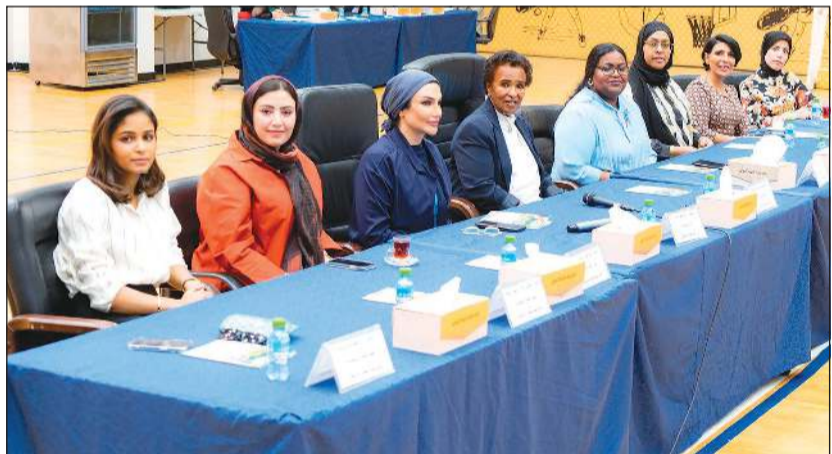
جانب من عمومية نادي سلوى الصباح