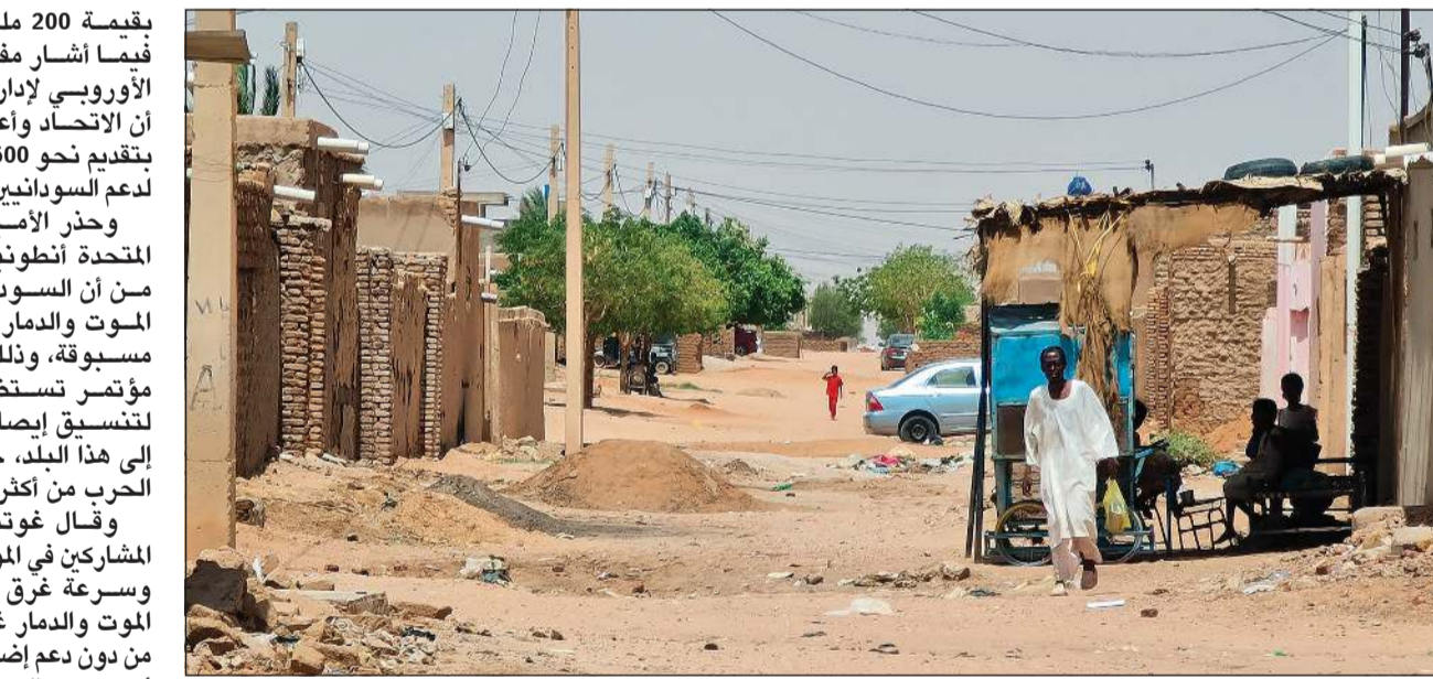
مواطن سوداني يسير قرب منزله بالخرطوم وسط معاناة إنسانية متزايدة بسبب الصراع المسلح المتواصل

وتعهد المانحون بتقديم نحو 1,5 مليار دولار للمساعدة في تخفيف الأزمة الإنسانية في السودان والدول المجاورة التي تستضيف لاجئين فارين من القتال بحسب ما أعلنت الأمم المتحدة. وأكد وزير الخارجية