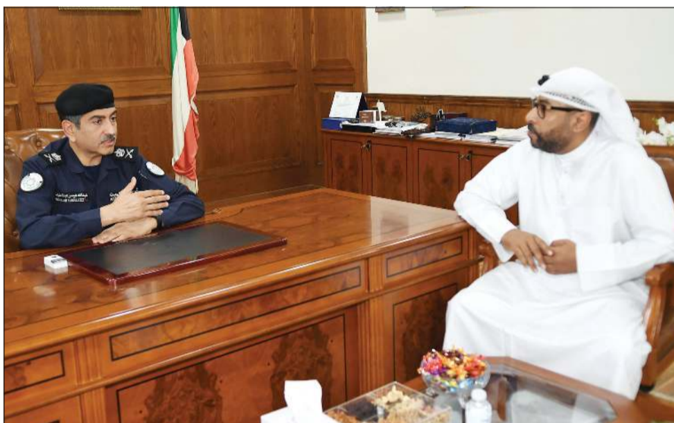
اللواء عبدالله الرجيب يتحدث إلى الزميل أحمد خميس خلال اللقاء

أين دوريات الفريج؟ في الأصل قطاع شؤون الأمن العام هو أمن مناطقي من الدرجة الأولى فالمخافر طاقته تعمل على مدار الساعة ومن مسؤوليتها التصدي للجريمة والوقاية منها، وهذا يأتي من خلال التواجد الأمني وانتشار الدوريات الأمنية داخل المناطق السكنية والشوارع الداخلية لهذه المناطق لاسيما يتم التركيز على تكثيف الدوريات، ليلاً، حيث السكنية والهدوء، وهذا ليعتد روح الطمانينة لدى الأهالي وشعورهم بالأحاساس