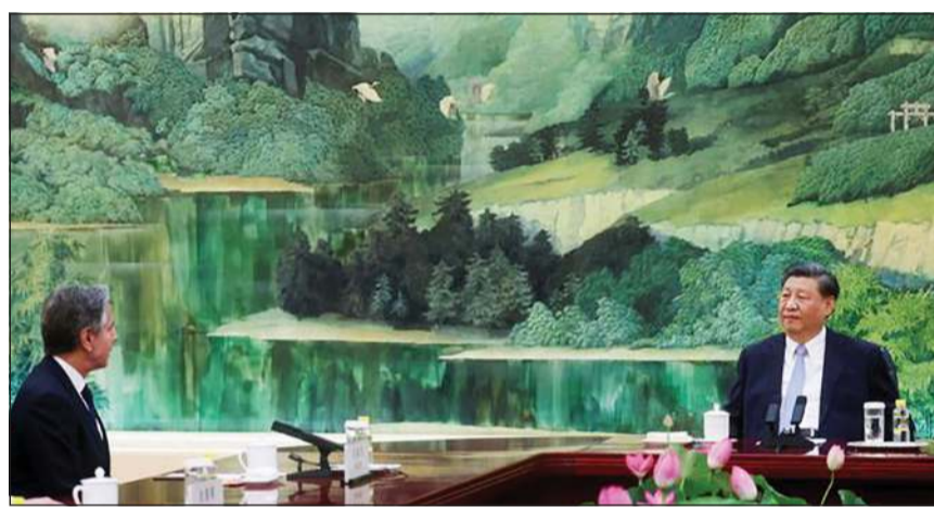
الرئيس الصيني شي جين بينغ خلال لقائه وزير الخارجية الأمريكي أنتوني بلينكن

غير أنه لفت إلى أنه خلال الاجتماع كانت هناك محادثة قوية بشأن التحديات الإقليمية والعالمية، بما في ذلك الصراع الروسي - الأوكراني، معرباً عن الترحيب بالدور البناء للصين إلى جانب الدول الأخرى التي تعمل من أجل تحقيق العدل والسلام.