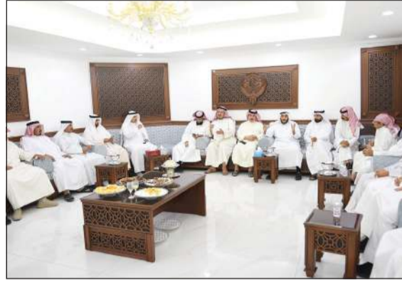
جانب من الحضور في ديوان الهاجري