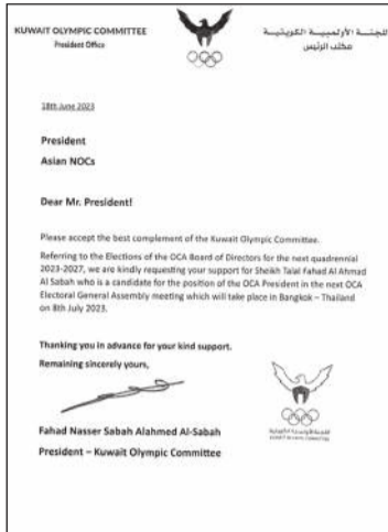
صورة ضوئية لكتاب «الاولمبية» إلى اللجان الأولمبية الآسيوية لدعم الشيخ د. طلال الفهد

وتنتظر الشيخ طلال الفهد العديد من الملفات مثل دورة الألعاب الآسيوية الـ 19 بمدينة هانغزو في الصين التي كان من المقرر إقامتها العام الماضي، ولكنها تأجلت إلى سبتمبر المقبل. وكذلك دورة الألعاب الشاطئية في مدينة بالي بإندونيسيا من 5 إلى 12 أغسطس المقبل، وبطولة آسيا للصالات المغلقة في باتوك من 17 إلى 26 نوفمبر المقبل.