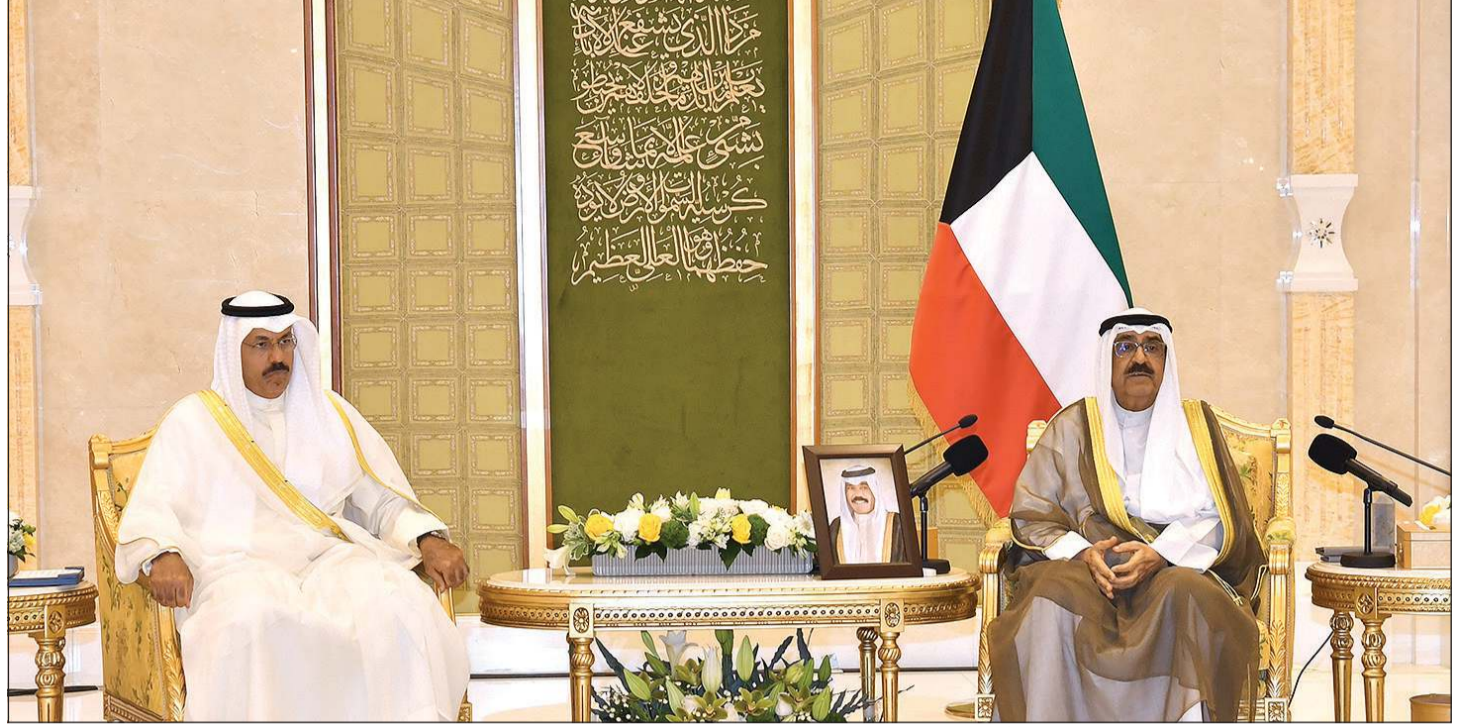
سمو نائب الأمير وولي العهد الشيخ مشعل الأحمد مستقبلاً سمو الشيخ أحمد نواف الأحمد الصباح لأداءه وأعضاء الحكومة اليمين الدستورية