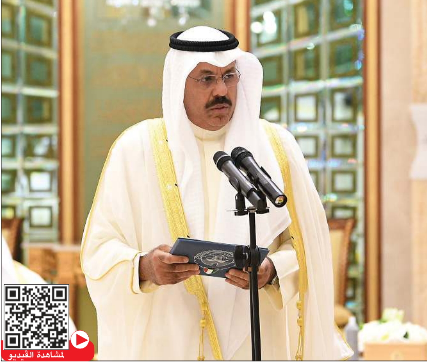
سمو الشيخ أحمد نواف الأحمد الصباح لدى لقائه كلمة أمام سمو نائب الأمير وولي العهد