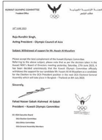
صورة ضوئية لكتاب اللجنة الأولمبية إلى القائم بأعمال رئيس المجلس الأولمبي الآسيوي