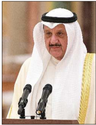
عيسى الكندري يؤدي اليمين الدستورية