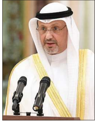
الشيخ سالم العبدالله