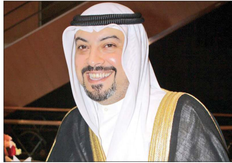
الشيخ د. طلال الفهد