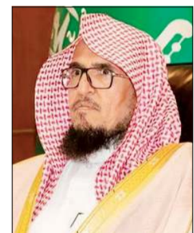
الشيخ د. يوسف بن محمد بن سعيد

وكالات: أعلن عن تعيين الشيخ د. يوسف بن محمد بن سعيد عضو هيئة كبار العلماء في المملكة العربية السعودية لإلقاء خطبة يوم عرفة لهذا العام 1444هـ. وتعيين الشيخ د. ماهر بن حمد المعقلي إمام وخطيب المسجد الحرام إماماً احتياطياً، وذلك الكريمة بهذا الشأن بحسب ما أوردت «العربية.نت» أمس. وشغل الدكتور يوسف بن محمد بن سعيد منصب أستاذ العقيدة والمذاهب المعاصرة بجامعة الإمام محمد بن سعود الإسلامية، وعضو مجلس عمادة البحث العلمي بالجامعة لمدة سنتين، ومحاضراً بجامعة الإمام محمد بن سعود الإسلامية 1415هـ.