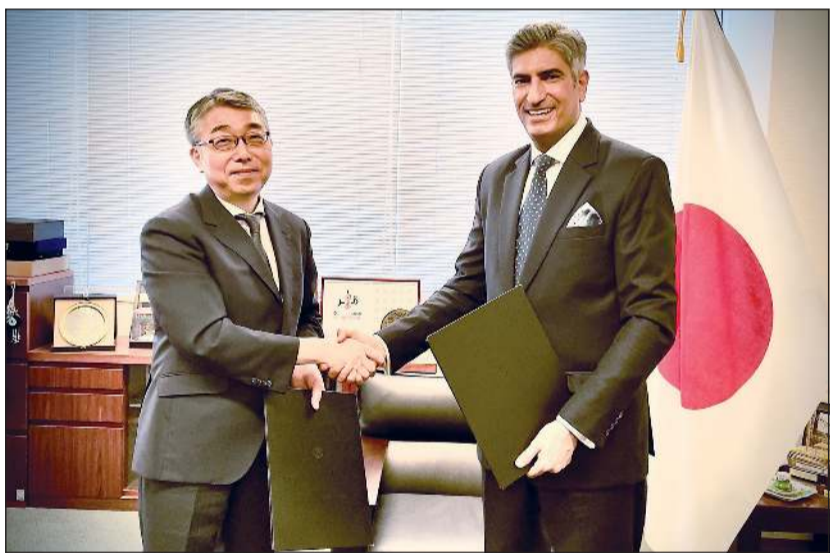
السفير سامي الزمان والسفير كانسوكي ناغاوكا بعد توقيع الاتفاقية

المذكرات الرسمية بهذا الشأن. وأضافت في هذا السياق أن هذا الاتفاق سيفعل بعد ثلاثة أشهر من دخوله حيز التنفيذ، واصفة إياه بأنه «إنجاز مهم» على مستوى العلاقات الثنائية وبشكل خطوة أولى باتجاه العمل على إعفاء حملة الجوازات الكويتية العادية من تأشيرة الدخول إلى اليابان على أن يكتمل الاتفاق في المستقبل القريب.