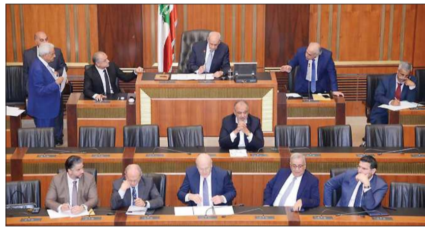
رئيس مجلس النواب نبيه بري مترشداً للجلسة التشريعية (محمود الطويل)