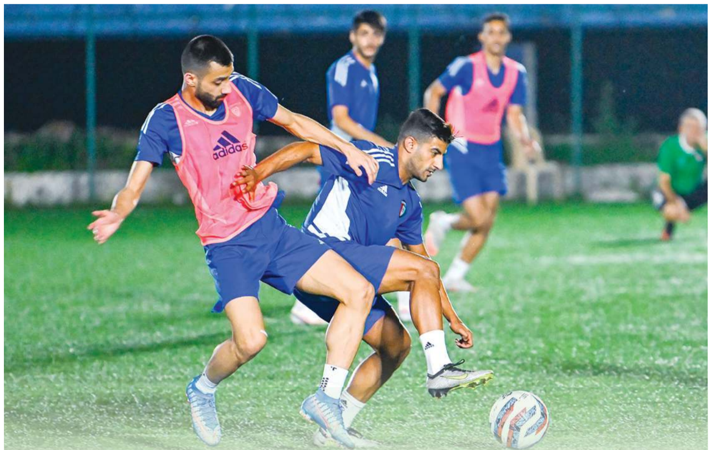
يجري تدريباً رئيسياً اليوم قبل مواجهة نيبال.. واستدعاء الحارس كميل

تسريبات حول رغبته في تأجيل البداية لمدة 7 أيام، وسيلتحق لاعبو «الأبيض» الدوليون، المنضمون لصفوف المنتخبين الوطنيين الأول والأولمبي، بالفريق الكويتاوي في معسكره بشكل مباشر.