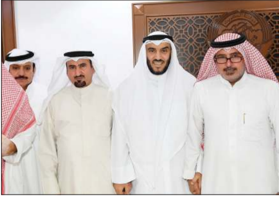
الهاجري خلال الاستقبال