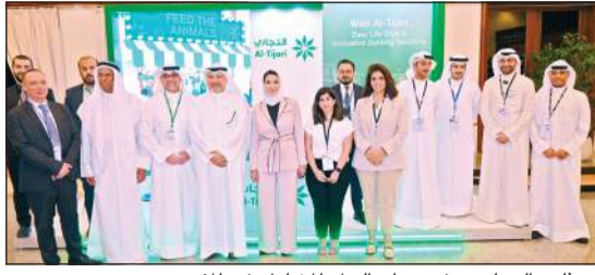
ممثلو «التجاري» في جناح البنك المشارك في المؤتمر

شارك البنك التجاري الكويتي بصفته راعياً ذهبياً لمؤتمر الكويت الثاني للشراكة بين القطاعين العام والخاص الذي نظمه اتحاد المكاتب الهندسية والدور الاستشارية الكويتية وشركة رازن لإدارة وتنظيم المعارض والمؤتمرات، وذلك في قاعة الهاشمي في فندق راديسون