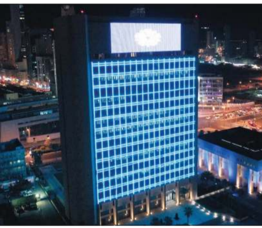
إضاءة مبنى الصندوق باللون الأزرق تضامناً مع اللاجئين حول العالم

الأحمر الكويتي من خلال توقيع عدة اتفاقيات تعاون لتمويل مشاريع تحسين الظروف المعيشية والصحية للاجئين السوريين والفلسطينيين ولأجني روهينغيا. ويهدفه المناسبة، ستم إضاءة مبنى الصندوق الكويتي باللون الأزرق تضامناً مع اللاجئين حول العالم، إيماناً منه بأهمية توفير سبل الحياة الكريمة وحماية وتحسين حياة اللاجئين والتخفيف عن معاناتهم. يذكر أن اليوم العالمي للاجئين، الذي حددته منظمة الأمم المتحدة في 20 يونيو من كل عام، يأتي دعماً للاجئين والنازحين في جميع أنحاء العالم وتسليط الضوء على قوة وشجاعة الأشخاص الذين أجبروا على الخروج من وطنهم نتيجة للصراع والاضطهاد والكوارث.