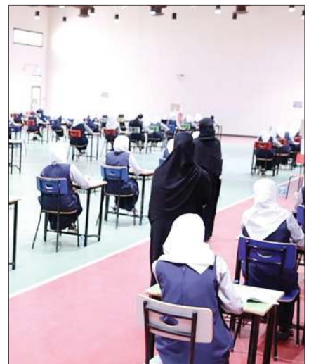
إحدى لجان الطالبات خلال الاختبار