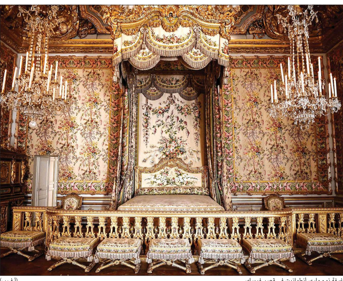
غرفة نوم ماري أنطوانيت في قصر فرساي