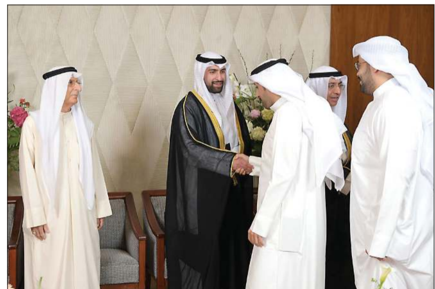
مهتتون بالمناسبة السعيدة