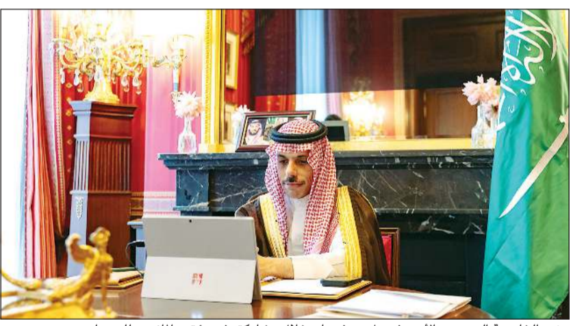
وزير الخارجية السعودي الأمير فيصل بن فرحان خلال مشاركته في مؤتمر المانحين للسودان

الهدنة المؤقتة الجديدة بالسودان في يومها الثاني، فيما أكدت الألية الثلاثية المكونة من الأمم المتحدة والاتحاد الأفريقي وهيئة الإيقاد «الحاجة الملحة إلى هدنة إنسانية دائمة للسماح لاجئين فارين من القتال بحسب السويديين المحتاجين». التفاصيل ص 19