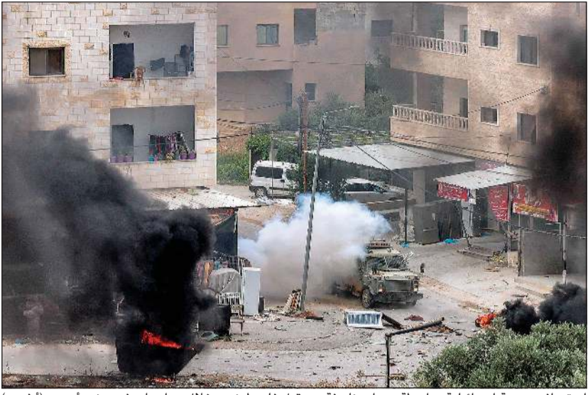
استهداف مدرعة إسرائيلية بواسطة عيوب ناسفة من قبل فلسطينيين خلال مواجهات في جنين أمس

الطواقم الطبية في عدة أماكن من المدينة. وأسفرت الاشتباكات المسلحة عن إصابة سبعة عناصر من القوات الإسرائيلية بجروح. وهذه هي المرة الأولى التي تستخدم فيها طائرات مروحية عسكرية إسرائيلية لقصف مواقع فلسطينية في جنين منذ الانتفاضة الفلسطينية الثانية، بحسب مصدر أمني فلسطيني طلب عدم ذكر اسمه لوكالة فرانس برس.