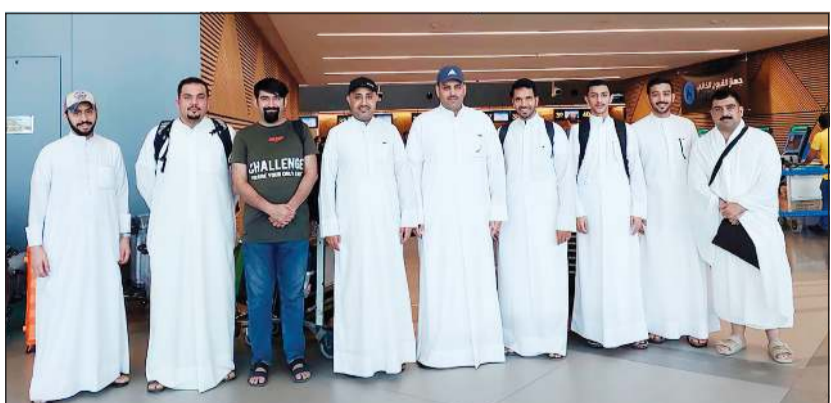
صورة جماعية للوفد

إلى مكة لضمان القيام بأعمالهم على أكمل وجه، كما سحرس على استخدام الوسائل التكنولوجية لتقديم أفضل خدمة للحجاج. وأشارت الهيئة إلى أن مثل هذه المناسبات المهمة تعد فرصة لتبادل الخبرات وعكس الصورة الإيجابية للشباب الكويتي المحب للأعمال التطوعية والإنسانية. وأكدت حرصها على مد جسور التعاون مع المؤسسات الحكومية والقطاع الخاص وجمعيات النفع العام ذات العلاقة بالشباب لتحقيق تطلعاتهم وتمكينهم من الإسهام بعجلة التنمية بالبلاد تعزيزاً لدورها في إعلاء مبادئ العمل التطوعي.