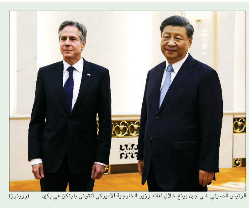
الرئيس الصيني شي جين بينغ خلال لقائه وزير الخارجية الأمريكي أنتوني بلينكن في بكين

أعلن الرئيس التنفيذي لشركة نفط الكويت أحمد العبدان، أنه وبالتنسيق مع الرئيس التنفيذي ونائب رئيس مجلس إدارة مؤسسة البترول الكويتية الشيخ نواف السعدي، تم قبول واستيعاب جميع المتقدمين الكويتيين حديثي التخرج من حملة شهادة البكالوريوس الفني الذين اجتازوا الاختبارات المقررة لهم، وعددهم 223 كويتي. في تخصصات بعلوم الميكانيكا (قوى محرك) والميكانيكا إنتاج (هندسة التصنيع)، بالإضافة إلى تخصصي بعلوم مختبرات كيمياء تطبيقية وعلوم صناعات كيميائية. التفاصيل ص 16