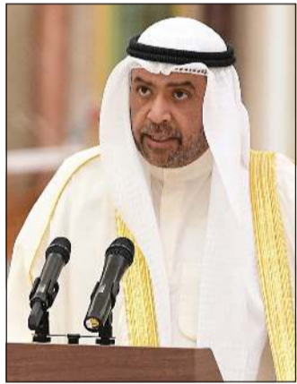
الشيخ أحمد الفهد لدى أداءه اليمين الدستورية