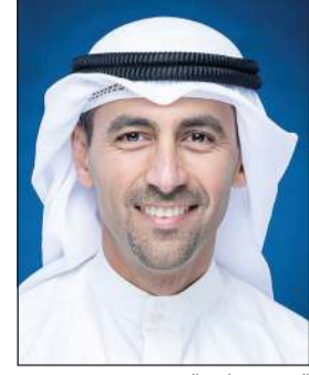
الشيخ نواف السعود

رويترز: قال الرئيس التنفيذي لمؤسسة البترول الشيخ نواف السعود أمس، إن الطلب الصيني على النفط من المتوقع أن يستمر في الارتفاع خلال النصف الثاني من العام.