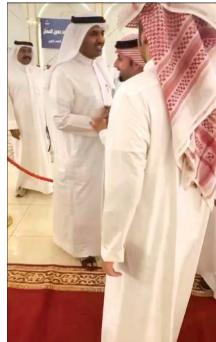
... ويتلقى التهاني