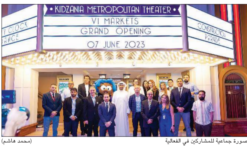
صورة جماعية للمشاركين في الفعالية

دخلت شركة «في أي ماركيتس» في شراكة مع One Financial Markets لتزويد المستثمرين في الكويت والشرق الأوسط بخدمات تداول مخصصة عبر الإنترنت من خلال هذه الشراكة، وتفخر «في أي ماركيتس» بتزويد المستثمرين بفرصة تداول العملات و عقود الفروقات على المؤشرات والسلع والطاقات والعقود الآجلة.