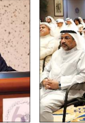
جانب من الحضور خلال الندوة

تجدد الإشارة إلى ان «جاكبا» تأسست عام 1974 كمظلة حكومية مستقلة، بعد ان كانت تابعة لوزارة الخارجية اليابانية، حيث تقوم بتنسيق المساعدات التنموية الرسمية لحكومة اليابان، وتختص بدعم النمو الاقتصادي والاجتماعي في الدول النامية وتعزيز التعاون الدولي. ولدى «جاكبا» شبكة تتكون من 97 مكتباً حول العالم ومشاريع في أكثر من 150 دولة بميزانية سنوية تصل إلى تريليون ين ياباني.