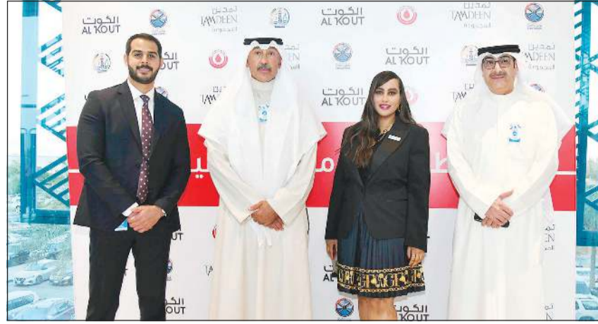
الشيخ فواز الخالد مع فريق البنك

أعلن بنك برقان اختتام رعايته ومشاركته في حملة محافظة الأحمدية الرابعة للتبرع بالدم، والتي تم تنظيمها في مجمع الكويت مول، تحت شعار «قطرة من دمك.. حياة لغيرك»، برعاية محافظ الأحمدية الشيخ فواز الخالد، كما أنها جزء من برنامج البنك للمسؤولية الاجتماعية وجوهده المشتركة مع الجهات الحكومية لتحقيق رفاهية المجتمع. وحققت الحملة نجاحا كبيرا، حيث تمكنت من توفير مخزون كاف من مختلف فصائل الدم، ولاسيما النادرة منها، بمجموع 161 كيس دم، ليساهم ذلك في تأمين احتياجات بنك الدم وضمن مواصلة إنقاذ حياة المرضى ممن هم في أمس الحاجة إلى نقل الدم، إضافة إلى دورها المهم في رفع مستوى الوعي العام بأهمية المشاركة في المبادرات والأعمال الإنسانية النبيلة.