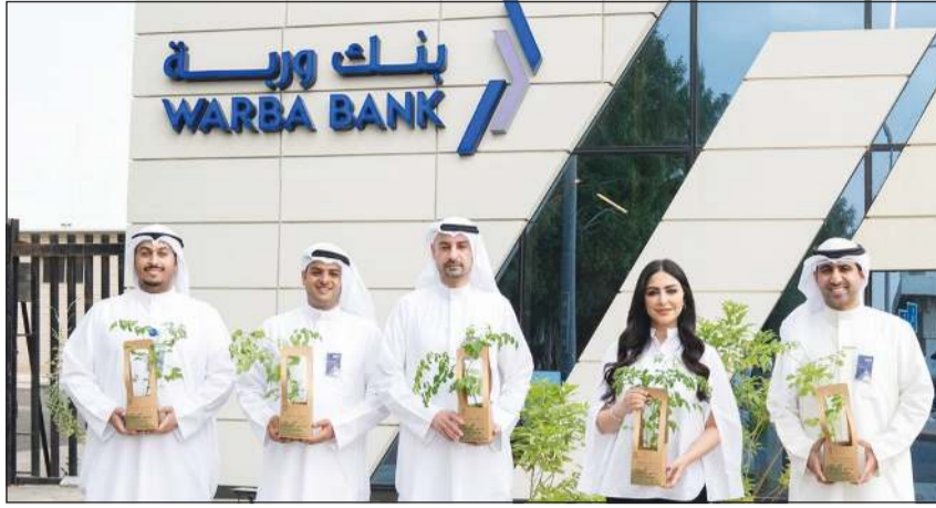
جانب من زراعة شتلة المورينغا في فرع البنك بالعديلية

أعلن بنك وربة عن توقيع اتفاقية تعاون مع مبادرة «اشتلتها بالمجان» لشجرة المورينغا تسري حتى 31 ديسمبر المقبل وذلك في إطار استراتيجيته للمسؤولية الاجتماعية، وإيماناً بدوره الريادي في نشر التوعية بأهمية الحفاظ على البيئة والزراعة.