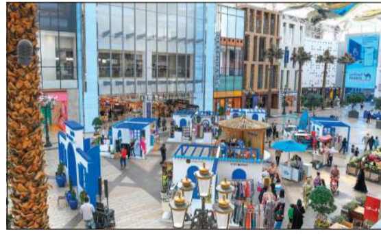
إقبال كبير على المعرض