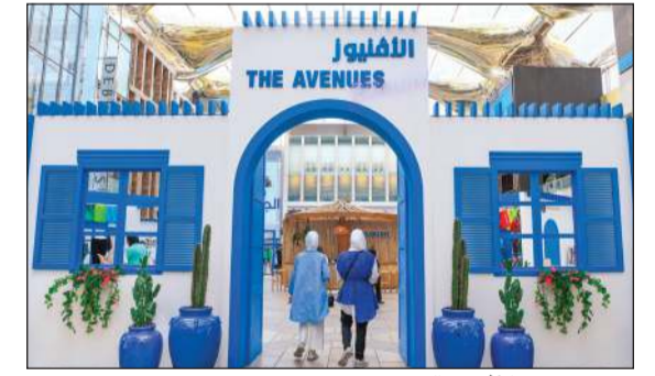
مدخل معرض الأفتنيوز الصيفي

تعتبر من أكثر الوجهات الصيفية إقبالا، وحظي المعرض بإقبال كبير من الزوار الذين أشادوا بتلك الفعالية التي جمعت مختلف أساسيات السفر من الحقائب والأزياء والأحذية والإكسسوارات، وهو ما جعل مهمة التسوق للاستعداد للعطلات الصيفية أكثر متعة وسهولة.