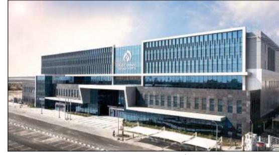
مستشفى «ضمان» في الأحمدى

حصل ثامر عرب، الرئيس التنفيذي في شركة مستشفيات الضمان الصحي (ضمان)، على جائزة CEO Today Middle East للعام 2023 عن الكويت ضمن كوكبة من الرؤساء التنفيذيين تكريماً وتقديراً للإنجازات البارزة والأداء القيادي المتميز في إدارة شركاتهم ضمن منطقة الشرق الأوسط.