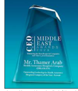
جائزة الأداء القيادي المتميز للرؤساء التنفيذيين في الشرق الأوسط

وجمهورية مصر العربية والمزيد، حيث تغلب هؤلاء القادة الاستثنائيون على التحديات، ووضعوا معايير جديدة للنجاح في مجالهم. يذكر أن عرب تولى مناصب قيادية وعضويات في مجالس إدارات مؤسسات كبرى خلال مسيرة مهنية تتجاوز 27 عاماً، وتتضمن مسيرته المهنية تحقيق إنجازات ملموسة في مؤسسات كبرى ضمن قطاع المصارف والتأمين والطيران والصحة. وهو حاصل على شهادة البكالوريوس في علوم الكمبيوتر من جامعة ولاية كاليفورنيا إضافة إلى عدد من البرامج التدريبية المتخصصة في العديد من المجالات مثل القيادة، والاستراتيجية والاقتصاد والعمليات.