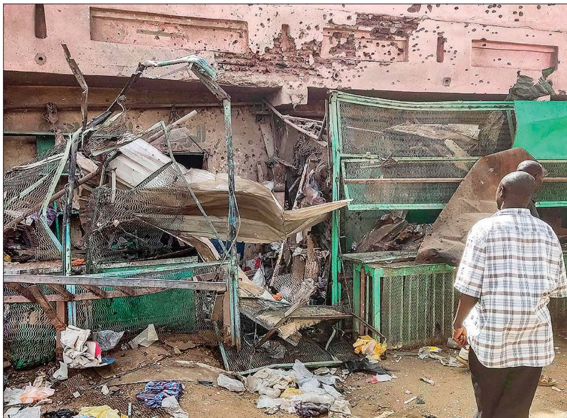
مواطن سوداني أمام مبنى مركز طبي مليء بتقوى الرصاص في سوق سيتا جنوب الخرطوم

الالتزام بوقف إطلاق النار، ستكون الولايات المتحدة والسعودية على استعداد لاستئناف المحادثات المعلقة للتوصل إلى حل لهذا الصراع». وفي نيويورك، جدد الأمين العام للأمم المتحدة أنطونيو غوتيريش التأكيد على دعمه لمبعوثه الخاص إلى السودان فولكر بيرتيس.