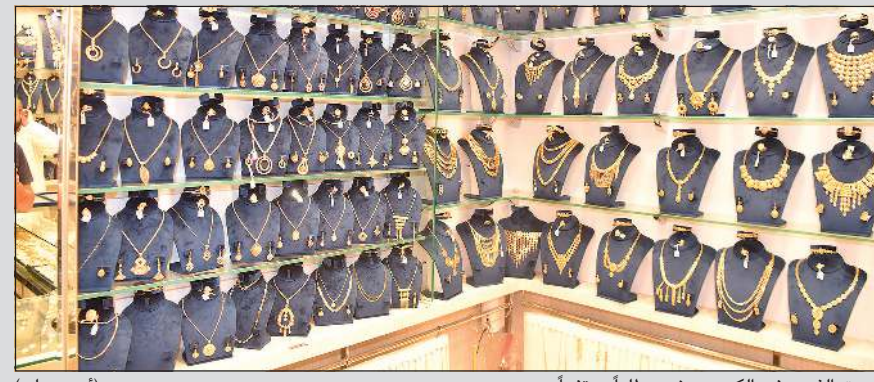
سوق الذهب في الكويت يشهد طلباً مرتفعاً

خبراء لـ «الأنباء»: إمدادات الذهب إلى الكويت آمنة ولم تتأثر بالطلب المرتفع