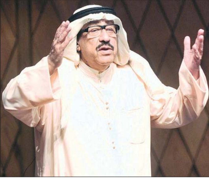
الفنان القدير عبدالعزيز المفرج «شادي الخليج»

من جانب آخر، ويسألنا علي عن شعور والده «شادي الخليج» بعد وفاة الفنان القدير عبد الكريم عبدالقادر، أجاب: والدي حزن حزنا شديدا على رحيل يوحنا، رحمه الله، وأكد أن أعمال عبدالقادر ستظل راسخة في أذهان الأجيال المتعاقبة، كما شدد والدي على أن الفقد قامة كبيرة في الفن الكويتي والخليجي والعربي، وكانت له إسهامات بارزة في مسيرة وتطور وإزدهار الأغنية الكويتية، ومشوار حافل من العطاء والإبداع، ودعا المولى عز وجل أن يتغمد الراجل الكبير بواسع رحمته، وأن يلمهم أسرته الكريمة ومحبي صوته وفنه الأصيل الصبر والسلوان.