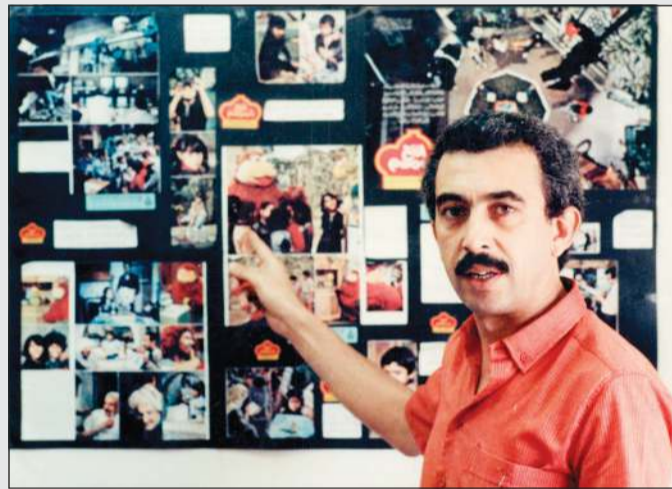
الراحل أسامة الروماني عندما كان مراقبا لبرنامج «افتح يا سمسم»