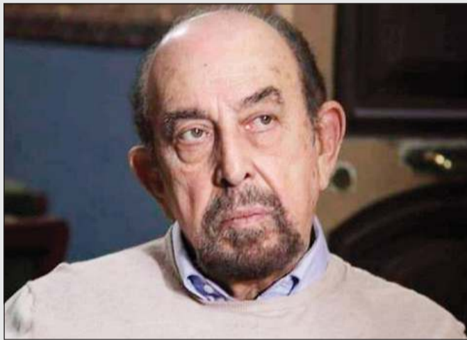
الراحل في أيامه الأخيرة