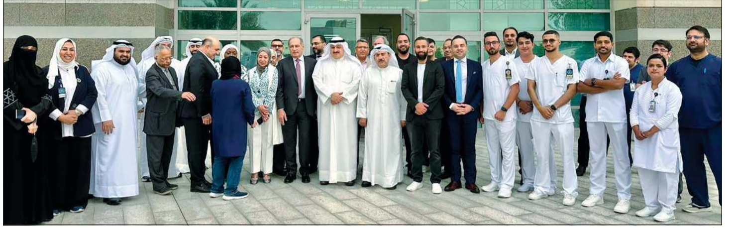
د. أحمد العوضي في صورة جماعية مع العاملين في المركز

في إطار توفير رعاية صحية عالية الجودة للمواطنين، افتتح وزير الصحة د. أحمد العوضي أمس مركز جابر لعلاج القدم السكري والعلاج بالأكسجين المضغوط وذلك بمستشفى جابر الأحمد التابع لوزارة الصحة. وبهذه المناسبة، قال د. العوضي إن المركز يعد إضافة للخدمات الصحية التخصصية وتم تزويده بجميع الأجهزة اللازمة لاستقبال وتشخيص ومعالجة الأمراض والجروح المتعلقة بحالات سكر القدمين، واستقبال الحالات التي تتم معالجتها عن طريق استخدام أجهزة الأكسجين المضغوط والتي تم توفيرها