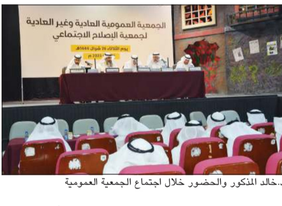
دخالد المذكور والحضور خلال اجتماع الجمعية العمومية

2023م، تتفق وأحكام مبادئ الشريعة الإسلامية وفقاً للمرجعية الشرعية التي حددتها إدارة نماء بهذا الخصوص. هذا، وأقرت الجمعية العمومية غير العادية تعديل المادة (1/26) من النظام الأساسي للجمعية وتعديل المادة (29 و 37) من النظام الأساسي مع إضافة مادة جديدة على النظام تتعلق بنشاط الحضانة.