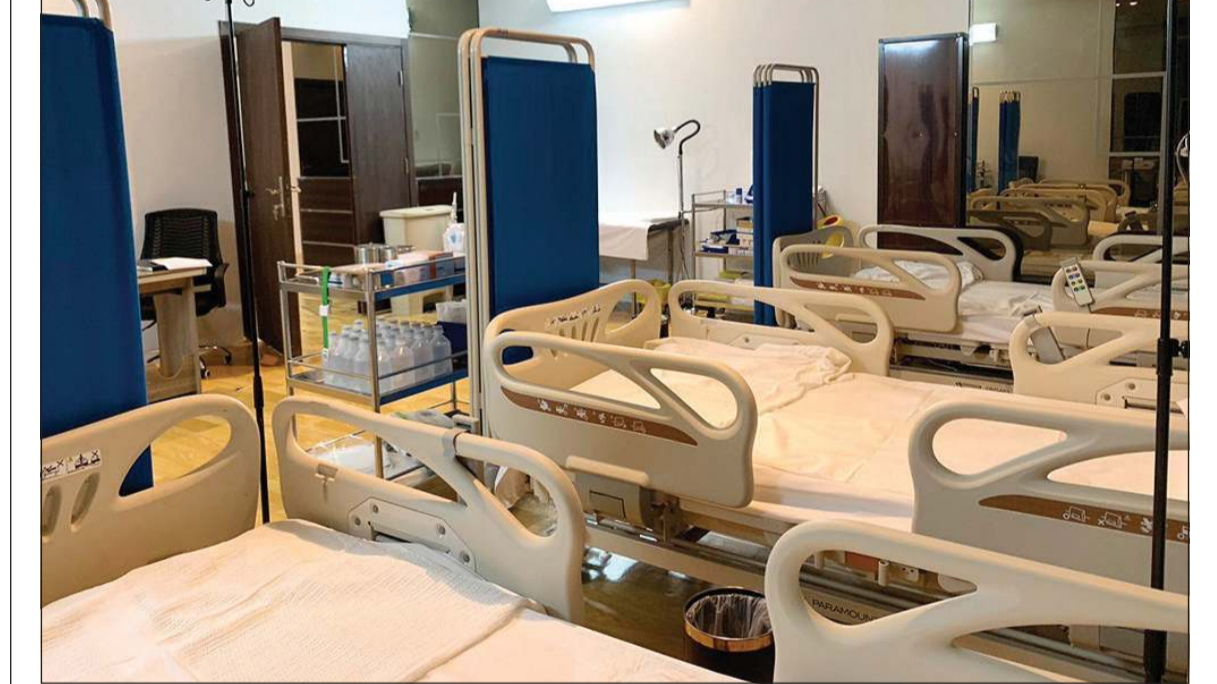
صورة أرشيفية لبعض تجهيزات الطبية في عيادة الخدمات الطبية التابعة لبعثة الحج الكويتية

وأضاف أنه و أعضاء السفارة استمعوا واطلعوا إلى الاختراع الذي قدمته الشهاب إضافة إلى الاختراعات المشاركة من دول مجلس التعاون، معرباً عن تفاؤله بالاختراعات