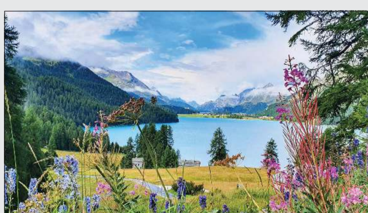
الطبيعة في غراو حيث الاستجمام في أشهر الصيف

العديد من فرص التسوق مع ساعات العمل الممتدة، بالإضافة إلى الكثير من وسائل ووجهات الترفيه ولعب للجولف. بينما تقع لوغانو بشكل مثالي بين البحيرة والجبال، وهي مكان حيوي يقدم العديد من الأنشطة لأولئك الذين يرغبون في الاستفادة من الضيافة السويسرية والإقامة الفاخرة، مع التمتع بتأثير نمط الحياة المتوسم. تعتبر لوغانو وجهة ذات طابع خاص، تقدم مجموعة واسعة من العروض الثقافية والمغامرات العائلية في