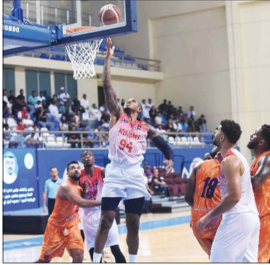
جانب من لقاء سابق جمع الكويت وكاظمة (متمين غوزال)

يخوض الفريق الأول لكرة السلة بنادي كاظمة مباراة صعبة عندما يواجه فريق الكويت في الـ 6:00 مساءً غد السبت على صالة الاتحاد بجمع الشيخ سعد العبدالله بضاحية صباح السالم، ضمن المباريات المؤجلة من القسم الثاني للدوري الممتاز. ويسعى «البرتغالي» الذي يتصدر الترتيب بـ 19 نقطة، لإلحاق أول هزيمة بالكويت (16 نقطة) بطل الخليج والعرب في العام 2023، فيما يأمل «الأبيض» من جهة مواصلة زعامته لكرة السلة دون خسارة، واستعادة الصدارة بالفوز في مباراته أمام كاظمة غداً، والثلاثة المقبل من القادسية، حيث أدت انتصاراته المتتالية في دوري «السوبر ليغ» الآسيوي لمنطقة الخليج، وتأهله إلى المباراة النهائية في مواجهة المنامة البحريني إلى تأجيل مباراته في الدوري. وعلى الورق ونفسياً، تبدو كفة «العميد» راجحة، فالفريق يمر بأفضل حالاته الفنية، ويقدم أداءً فنياً متصاعداً رغم