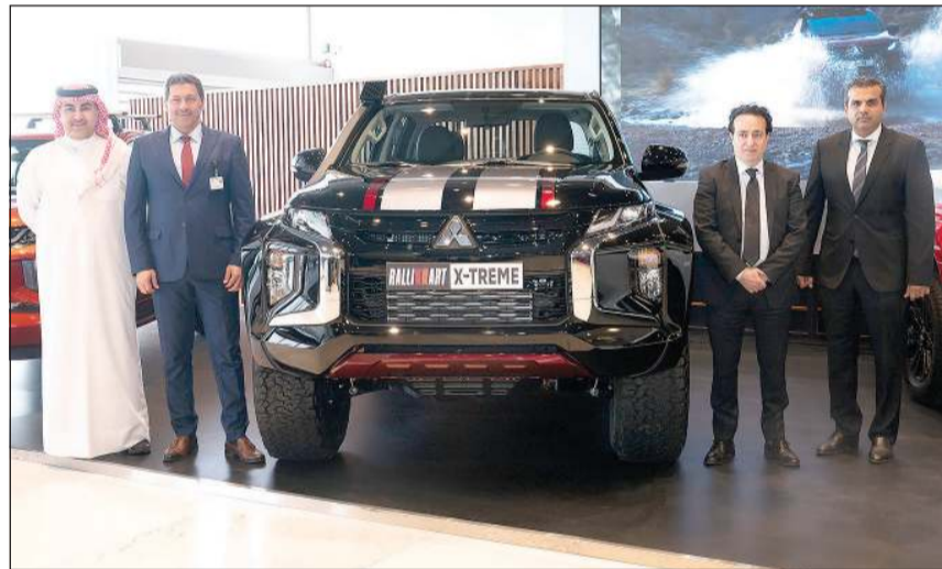
إداريو «الملا موتورز» بعد الكشف عن مجموعة «رالي آرت» الجديدة

بسعة 2,4 ليتر، يولد قوة يصل مقدارها إلى 137 حصانا مع إمكانية إضافة 30 حصانا لمزيد من القوة. الفئة الثالثة هي Ralliart Edition، المميزة بتصميمها البسيط وبمحركها الذي يأتي بسعة 2,4 ليتر ويولد قوة يصل مقدارها إلى 137 حصانا، كما يعمل أيضا بنظام الديزل تيربو بحيث يصل معدل استهلاك الوقود إلى 13,8 كم/لتر، كما تم توفير ناقل حركة أوتوماتيكي من 6 سرعات. وتتميز جميع هذه المركبات بأنظمة الأمان والحماية المتكاملة التي تمنح قائدها أفضل تجربة قيادة، وتشمل مراقبة ضغط الهواء في الإطارات، ونظام التحكم في الثبات، وتقنية دعم المكابح، بالإضافة إلى وسادتين هوائيتين.