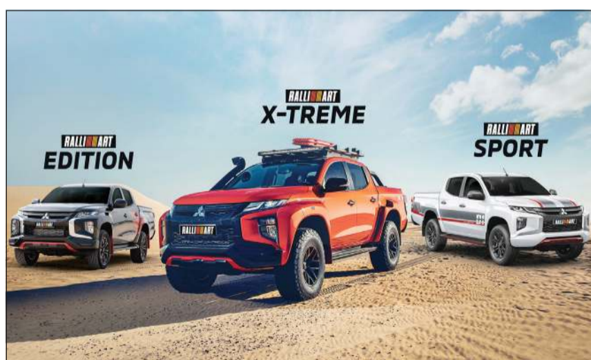
شاحنات رالي آرت للطرق الوعرة والقيادة الرياضية من ميتسوبيشي موتورز