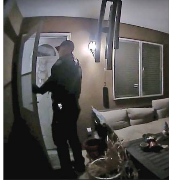
لقطة من مقطع فيديو للشرطة أثناء طرق الباب

وأكد البرنامج المعلن ما أورده تقارير صحافية عن رفض النجوم البريطانيين الرئيسيين المشاركة في الحفلة، ومنهم التون جون وأديل وإد شيران وهاري ستايلز.