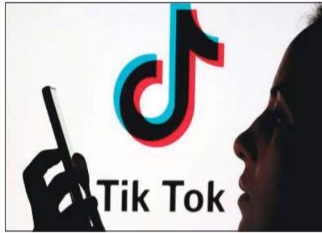
حظر «تيك توك» في مونتانا سيواجه طعناً

لهذه الولاية الواقعة في شمال غرب البلاد، والتي يزيد عدد سكانها قليلاً على مليون نسمة، وعلى غرار أعضاء كثيرين في الكونغرس من الحزبين الديموقراطي والجمهوري، يعتقد ممثلو ولاية مونتانا أن المنصة التي يستخدمها 150 مليون أميركي لمتابعة مقاطع فيديو قصيرة ومسلية، تسمح لبكين بالتجسس على المستخدمين والتلاعب بهم.