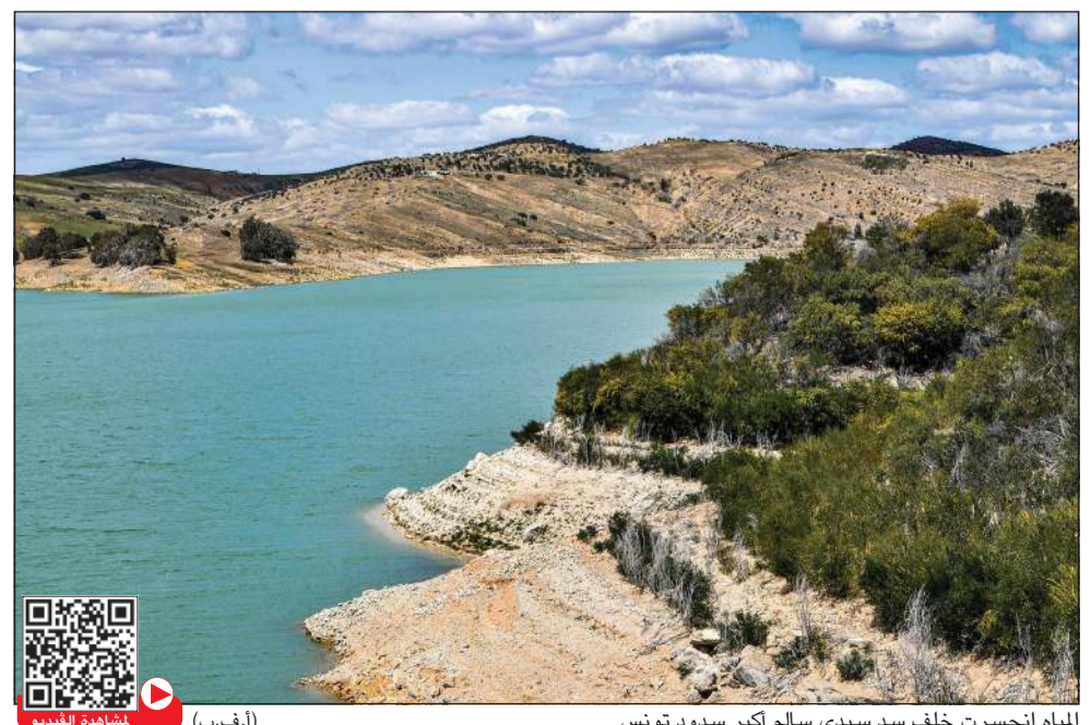
المياه انحصرت خلف سد سيدي سالم أكبر سدود تونس

مجاز الباب (تونس) - أ.ف.ب: يردد التونسيون المثل الشعبي «مطر مارس ذهب خالص»، لكن أنحياض الأمطار هذا العام يهدد بموسم إنتاج حبوب «كارثي» في تونس التي تمر بأزمة جفاف وشح غير مسبوق في المياه. وتشهد تونس ذات المناخ شبه الجاف تراجعاً كبيراً في تساقطات الأمطار وشحاً في الموارد المائية ما أثر بشكل مباشر على الزراعة وخصوصاً قطاع الحبوب. حيث لم يتجاوز معدل المتساقطات في منطقة مجاز الباب خلال فصل الخريف والشتاء المئة ملليمتر لذلك قرر عشرات المزارعين في المنطقة حثرت ما نبتت من المحصول أو تخصيصه مرعى لقطعان الأبقار والأغنام. تعتبر منطقة مجاز الباب وكامل محافظة باجة «مطمورا» (مزودا) أساسياً لكامل محافظات البلاد بالقمح والحبوب، ولكن سد سيدي سالم الأكبر لتجميع المياه في المنطقة لم يتجاوز معدل امتلائه 16٪. أمام هذا الوضع غير المسبوق، أقرت السلطات الزراعية إجراءات مستعجلة نهاية مارس من أجل التحكم في الموارد المائية وأقرت نظام حصص لتزويد المياه الصالحة للشرب، كما منعت استعمال المياه في الزراعة وري الحدائق وغسل السيارات حتى سبتمبر المقبل. تحتاج السوق الاستهلاكية التونسية إلى ثلاثين مليون قنطار من القمح والشعير سنوياً وتستورد في غالب الأحيان 60 إلى 70٪ من حاجياتها من الأسواق الخارجية خصوصاً أوكرانيا وروسيا. لكن هذا العام «محصول الحبوب كارثي لن يتعدى الإنتاج 2,5 مليون قنطار سنجم منها 1,5 مليون قنطار فقط، مقارنة بالسنة الماضية 7 ملايين قنطار».