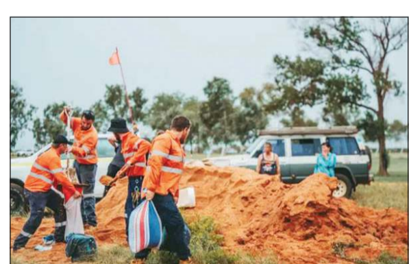
سكان بورت هيدلاند يملأون أكياس الرمال استعداداً للإعصار

سيدني - د.ب.أ: ذكرت تقارير أن إعصار إلسا الاستوائي ازدادت قوته إلى المستوى الخامس لدى عبوره ساحل شمال ولاية ويسترن أستراليا أمس الخميس، ليصبح الإعصار الأقوى الذي يضرب الولاية منذ 14 عاماً. وذكرت هيئة البث الأسترالية أن الإعصار حالياً مصنف ضمن المستوى الرابع، ويبعد 245 كيلومتراً شمال بورت هيدلاند، وتصحبه رياح سرعتها 185 كيلومتراً في الساعة، وزوايا بسرعة 260 كيلومتراً في الساعة. وصدر تحذير باللون الأصفر يغطي مساحة أكثر من 700 كيلومتر من الساحل بين منطقة في جنوب بوم إلى ويم كويج. يشار إلى أن آخر إعصار من المستوى الخامس ضرب ولاية أستراليا الغربية كان الإعصار لورانس في عام 2009.