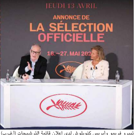
تيريو فريمو وأيريس كنبولوش لدى إعلان قائمة الترشيحات

باريس - أ.ف.ب: تتنافس على جائزة السعفة الذهبية في مهرجان «كان» السينمائي بدورته المقبلة الأفلام الجديدة لغم فندرزن وكن لوتش وويس أندرسون، مع عدد قياسي من المخرجات المرشحات في تاريخ الحدث، وفق ما أظهرت قائمة أعلنها أمس المدوب العام للمهرجان تيري فريمو وتجمع بين مخضرمين في الفن السابع وأسماء جديدة. وفي المحصلة، اختيرت تسعة عشر فيلماً قد يضم إليها عمل إيفانكا هو «كبلر أوف ذي فلاور مون» للمخرج مارتن سكورسيزي، والذي يشارك فيه ممثلان من أبطاله المفضلين هما ليوناردو دي كابريو وروبرت دي نيرو. ولإيزال عرض هذا الفيلم مقررًا خارج المسابقة الرسمية، لكن المهرجان يرغب في ضمه إلى المنافسة على السعفة الذهبية، وقال تيري فريمو إن «الطلب قدم» إلى شركتي «باراماونت» و«آبل تي في» المنتجتين للعمل، «والأهم أن نتلقى رداً قبل انطلاق المهرجان». ومن بين الأفلام الـ19 المرشحة للفوز بجائزة السعفة الذهبية تحمل ستة توقع مخرجات، بينهم التونسية كوثر بن هنية، التي عرض فيلمها السابق في فئة «نظرة ما» عام 2017، ومخرجة جديدة هي السنغالية راماتا تولا سي التي تقدم فيلمها الأول.