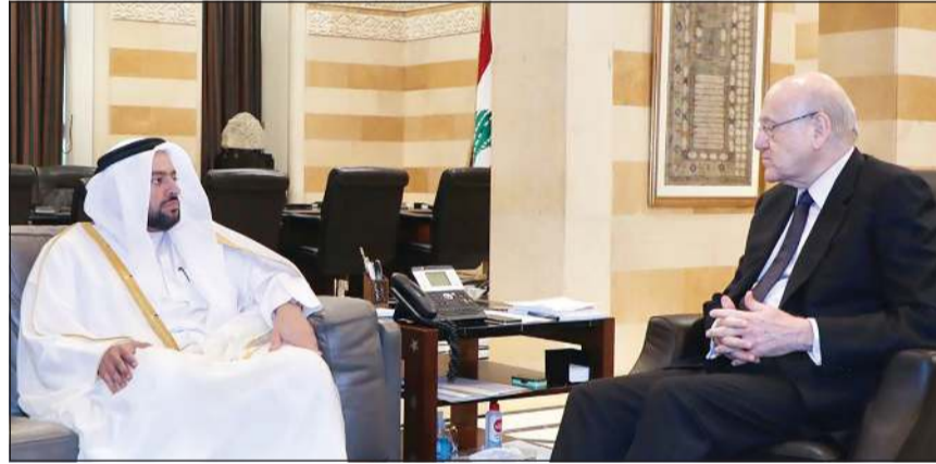
رئيس الحكومة نجيب ميقاتي ومستقبلا وزير الدولة للشؤون الخارجية القطري د.محمد بن عبدالعزيز الخليفي

النائب محمد رعد رئيس كتلة الوفاء للمقاومة كان قد قال: ان المدخل لإعادة بناء الدولة هو انتخاب رئيس. وأضاف: ان الطرف الآخر لم يترشح أو يدعم أي مرشح، لأنهم يراهنون على كلمة سر تأتي من الخارج، وفي رد غير مباشر على هذا، قال رئيس القوات اللبنانية سمير جعجع في مداخلة صباحية عبر إذاعة «لبنان الحر»: لدينا مرشح واضح المعالم هو ميشال معوض، الذي اقترعنا له في 11 جلسة، وكان عليهم ان ينتخبوه، بحكم انه كان معهم في مرحلة من المراحل