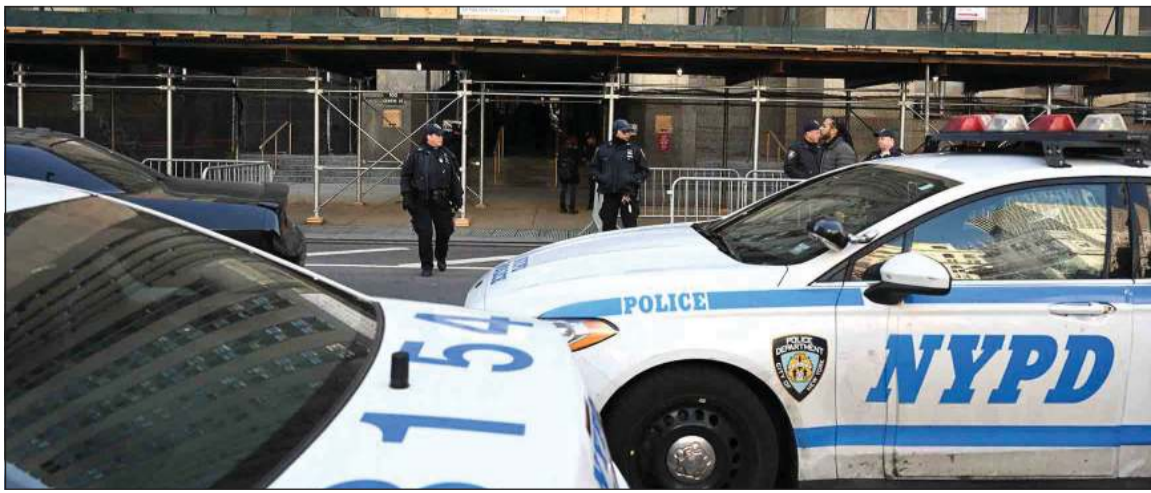
إجراءات أمنية حول محكمة مانهاتن

والاشنطن - وكالات: يسود الترقب والخاوف من اندلاع أعمال عنف في نيويورك التي تشهد اليوم منوال الرئيس الأميركي السابق دونالد ترامب أمام المحكمة في سابقة تاريخية في الولايات المتحدة، لإبلاغه رسمياً لألحة الاتهامات الموجهة ضده في قضية دفعه أموالاً لشراء صمت ممثلة ادعت إقافة علاقة معه. ويقول مساعده إن ترامب توجه من منزله في ماراغو في فلوريدا ليغادر إلى نيويورك لـ «تسليم نفسه». وهناك، في إطار الإجراءات المتوقعة لتوجيه التهمة الجنائية له، سيخضع الرئيس الأميركي السابق لإجراءات الحجز المعتاد عبر أخذ بصماته والتقاط صورته، التي قد تؤدي لواحدة من أشهر الصور الجنائية في العصر