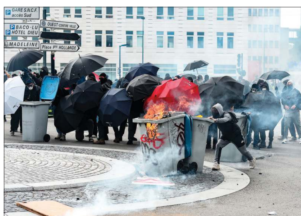
محتجون يحرقون حاويات قمامة ويحتمون من الغاز المسيل للدموع في نانت غرب فرنسا

باريس - وكالات: شهدت فرنسا أمس جولة جديدة من المواجهة بين المحتجين الرافضين لإصلاح قانون التقاعد والساعين لإجبار الرئيس إيمانويل ماكرون على التراجع عن المشروع الذي أقرته الحكومة دون التصويت عليه في الجمعية الوطنية. وفي عاشر يوم من الاحتجاجات التي عمت البلاد، تجددت الاشتباكات بين الشرطة التي استخدمت الغاز المسيل للدموع والمتظاهرين الذين أحرقوا فرع أحد البنوك في نانت، وحمل آخرون في باريس نعشاً كتب عليه «صندوق تقاعدكم الحديدي»، في إشارة إلى القانون الذي يرفع سن التقاعد إلى 64، كما تعطلت خدمات القطار وبعض رحلات الجوية وأغلقت بعض المدارس أبوابها مثلما كان الحال في أيام الإضرابات السابقة منذ منتصف يناير.