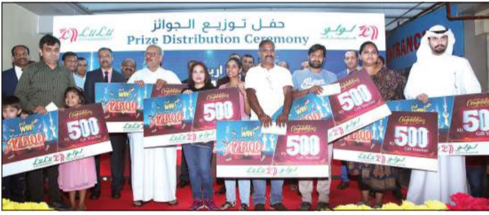
الفائزون بجائزة الـ 500 دينار

نظمت شركة «لولو هايبر ماركت»، شركة تجارة التجزئة المفضلة بين المتسوقين المميزين في المنطقة، حفل توزيع الجوائز في 25 مارس في منفذ الري تكريم الفائزين بعرض «هلا فبراير» الترويجي.