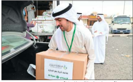
توزيع سلة رمضان على الأسر المتعفة

الخيرية والإنسانية الموجهة للفئات الأكثر احتياجاً. وعن آلية التبرع والمشاركة في حملة ضاعف أجرك مع التجاري، أوضحت أماني الورع أنه يمكن العمل الاجتماعي التطوعي والمساهمة في العديد من الفعاليات الإنسانية والخيرية في شهر رمضان الفضيل ضمن برنامج اجتماعي يدعم المبادرات