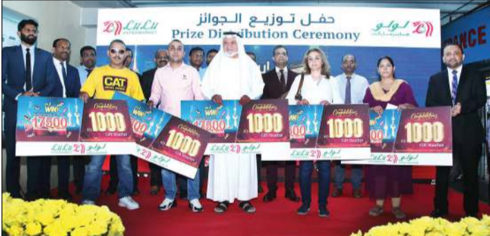
الفائزون بجائزة الـ 1000 دينار

ومنح عرض قسيمة هدايا لولو، الذي استمر من 1 فبراير إلى 11 مارس، والذي يعتبر جزءاً من احتفالات هلا فبراير في الكويت، المتسوقين الذين يشترن سلعا بقيمة 5 دنانير فرصة للفوز بقسائم هدايا من مختلف الفئات من مجموع جوائز بلغ مجموعها 17500 دينار. وشهد العرض الترويجي، الذي كان بجميع فروع الهايبر ماركت، تلقي 115 فائزا محظوظا قسائم هدايا مجانية، كما حصل 5 فائزين على قسائم هدايا بقيمة 1000 دينار، وحصل 10 فائزين على قسائم هدايا بـ 500 دينار، وحصل 50 فائزا على قسائم هدايا بـ 100 دينار لكل فائز، بينما تم توزيع قسائم هدايا على 50 فائزا آخرين بـ 50 ديناراً. وتم تسليم الفائزين قسائم الهدايا خلال حفل أقيم بحضور الإدارة العليا للهايبر ماركت، بعد إجراء السحب الرقمي لاختيار الفائزين في 20 الجاري بحضور مسؤولي وزارة التجارة والصناعة ومسؤولي شركة لولو هايبر ماركت.